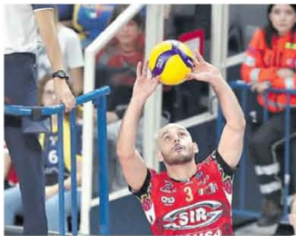
Il palleggiatore della Sir Zoppellari

DOMANI LA SFIDA IN CAMPIONATO POI IL DOPIO CONFRONTO IN CHAMPIONS LEAGUE