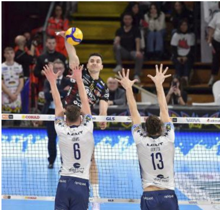
Il muro della Mint Vero Volley non è riuscita a contenere la forza di Perugia

SIR SUSA VIM PERUGIA-MINT VERO VOLLEY MONZA 3-1 (28-26, 23-25, 25-17, 25-16)