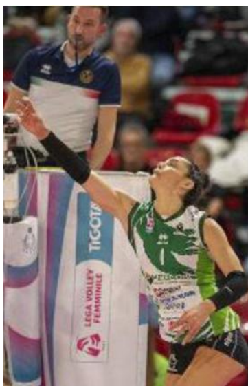
Bici (Megabox) in azione