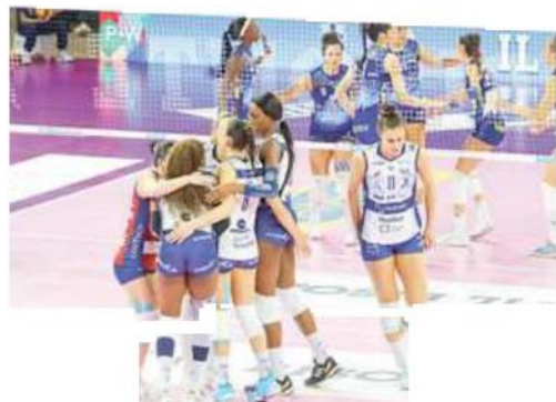
Le giocatrici della Numia Vero Volley di Milano in cui militano le campionesse olimpiche Egonu Orro, Sylla e Danesi festeggiano dopo un punto