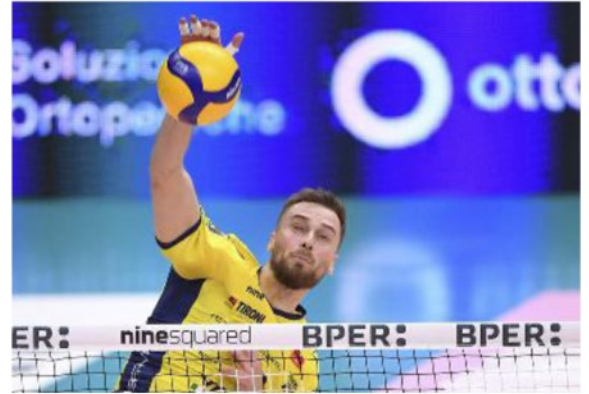
Buchegger sarà l'opposto al palleggiatore De Cecco