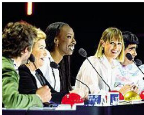
In televisione Egonu con i giudici di Italia's Got Talent