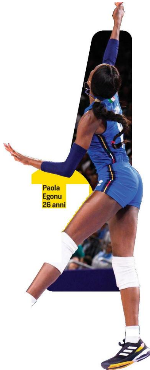
Paola Egonu 26 anni

Ritaglio Stampa a uso esclusivo del destinatario, Non riproducibile