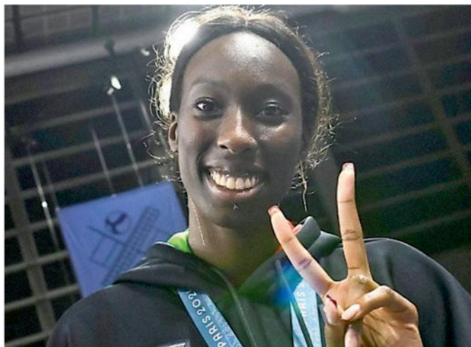
Paola Egonu da Galliera sul tetto del mondo dopo aver vinto la scorsa estate con l'Italia le Olimpiadi a Parigi e la Nations League