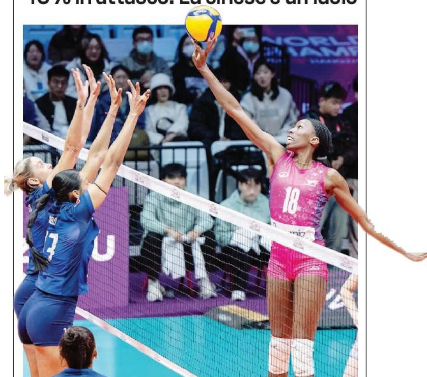
Paola Egonu, ieri protagonista, compie oggi 26 anni

Ritaglio Stampa ad uso esclusivo del destinatario, Non riproducibile