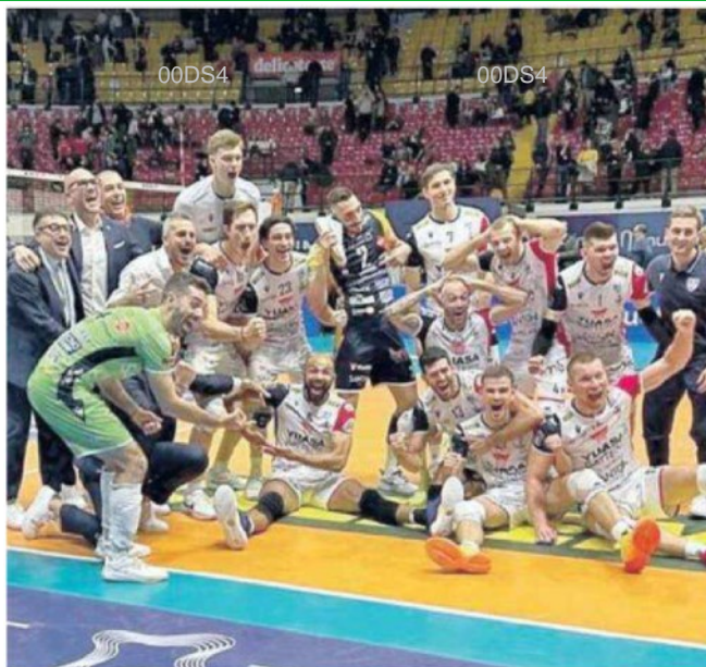
La Yuasa Battery Grottazzolina festeggia la prima storica vittoria

ARTICOLO NON CEDIBILE AD ALTRI AD USO ESCLUSIVO DEL CLIENTE CHE LO RICEVE - DS4 - S.33014 - SL_MAR