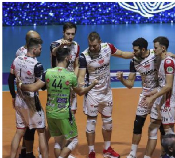
La Yuasa Battery si gode il risultato