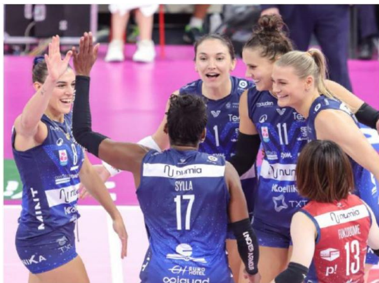
Esultano le ragazze della Numia Vero Volley

con un 3-1. Dopo un primo set che è stato dominato dalla solidità delle padrone di casa (25-22), le milanesi sono state brave a ribaltare il match. Nel secondo parziale, trascinate da Egonu e Daalderop, mettono in mostra tutto il loro potenziale e chiudono con il punteggio di 21-25. Il terzo set è un'autentica maratona: si va avanti punto a punto per tutto il parziale e il finale è al cardiopalma. Milano annulla diversi set point e alla fine è Egonu a siglare il definitivo 30-32. Nel quarto set Talmassons tenta una reazione con Milano che si ritrova a rincorrere. Da metà parziale le due squadre vanno di pari passo fino al 23-24, quando un errore delle padrone di casa sigla il 23-25 e consegna il match alla squadra di Lavarini. Per la Numia Vero Volley Milano sarà un'altra settimana impegnativa. Venerdì 22 novembre ci sarà il big match con le rivali di sempre della Prosecco DOC Imoco Conegliano.