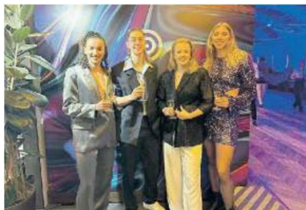
CORAZZATE In alto Conegliano e Milano dominano la scena italiana. Qui sopra le pantere presenti ieri sera alla Rinascente

L'ultimo confronto diretto fra le due superpotenze del volley rosa italiano ed europeo risale al 28 settembre quando al Palazzo dello Sport di Roma la Prosecco Doc Imoco, ancora priva di Zhu, piegò la resistenza delle milanesi vincendo la Supercoppa italiana al tie break davanti a 10.300 spettatori.