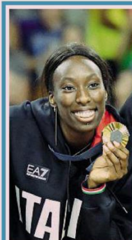
Paola Egonu La bomber 25enne di Cittadella è alla seconda stagione al Vero Volley. Ai Giochi eletta miglior giocatrice del torneo