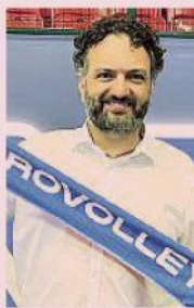
Il coach Stefano Lavarini, 45 anni, scudetto e Coppa nel 2024 in Turchia