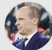
Il tecnico Massimiliano Allegri (56 anni)