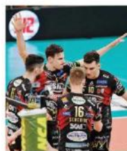
Festa Sir in gara 1 GALBIATI

H anno voglia di andare in fuga, Trento e Perugia. Voglia di indirizzare le serie più di quanto non abbiano già fatto in gara 1, tenendo fede al fattore campo e lasciando intendere di volersi andare a giocare il tricolore a fine mese, liquidando il tandem lombardo composto da Monza e Milano. Che pure per una notte almeno (se non ci sarà gara 4) saranno le capitali del volley nazionale. Dovranno però vincere per ribaltare l'inerzia di due serie che nel primo atto hanno sostanzialmente mantenuto fede alle attese. E per non ritrovarsi con l'acqua alla gola prima del tempo.