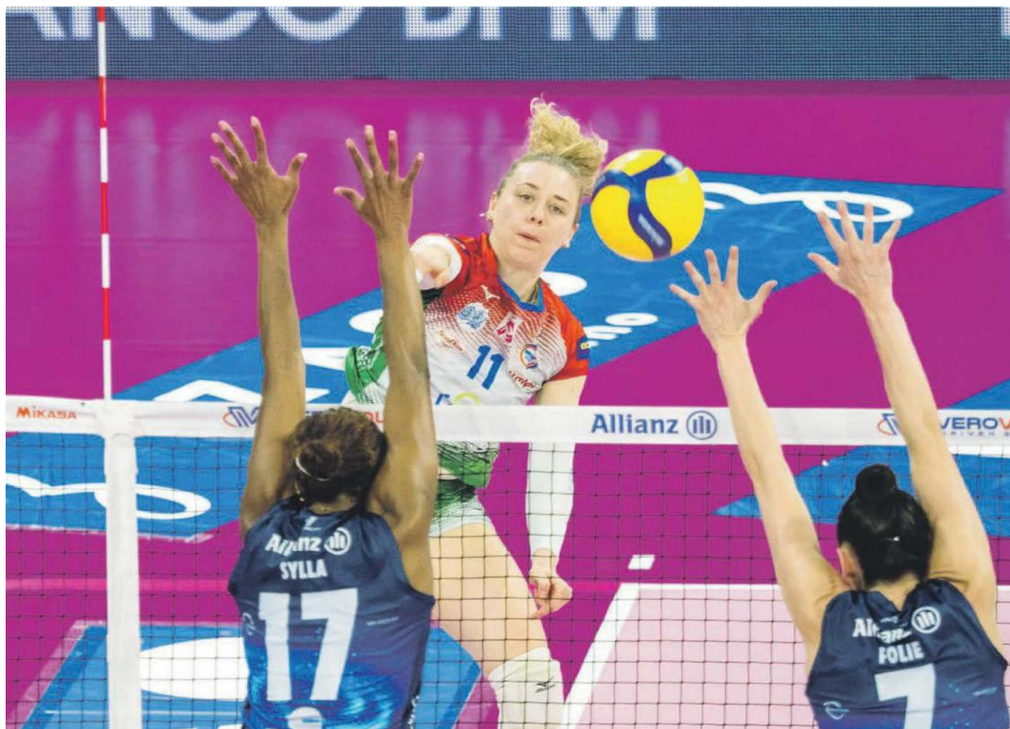
Nella cornice dell'Allianz Cloud, Pinerolo ha saputo insidiare le padrone di casa milanesi grazie ad una prestazione di carattere e sostanza: importante il contributo di Maja Storck, ripetutasi su ottimi livelli a Villafranca Piemonte, in un Pala Bus Company dove i 1.500 spettatori hanno assistito allo show di Egonu. Di rilievo il quarto set pinerolese.

Data: 03.04.2024 Pag.: 45,46 Size: 1962 cm2 AVE: € .00 Tiratura: Diffusione: Lettori: