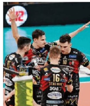
Festa Sir in gara 1 GALBIATI

6 aprile: Scandicci-Milano ore 20.30, diretta RaiSport, Sky Sport Uno, NOW e VBTV. 7 aprile: Conegliano-Novara/Chieri ore 20.30, diretta RaiSport, Sky Sport Uno, NOW e VBTV.