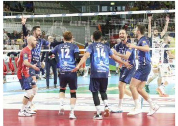
I giocatori del Monza Vero Volley festeggiano uno storico traguardo

ARTICOLO NON CEDIBILE AD ALTRI AD USO ESCLUSIVO DEL CLIENTE CHE LO RICEVE - DS4 - S.33014 - L.1851 - T.1851