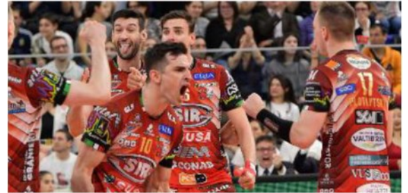
La prima gara della serie di finale è in programma giovedì contro Monza