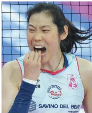
Zhu Ting, stella di Scandicci

Sotto lo sguardo del ct Velasco Scandicci conquista per la prima volta nella sua storia l'accesso alla finale scudetto e, in assoluto, al primo torneo in Italia. Finisce con un altro 3-0 (22-25, 22-25, 21-25), molto simile a gara-1. Avvio fulminante di Milano 6-2 con Egonu protagonista, ma è il muro toscano con Carol a firmare il primo vantaggio 16-17, che diventa 16-20, an-