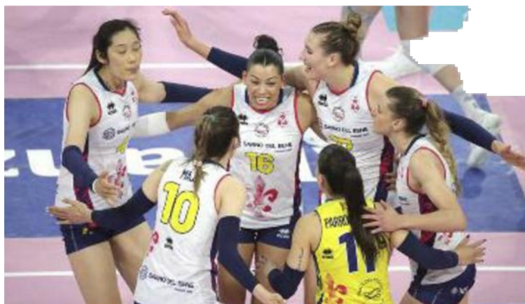
Prestazione di grande sostanza di tutto il gruppo della Savino Del Bene Scandicci

Ritaglio Stampa ad uso esclusivo del destinatario. Non riproducibile