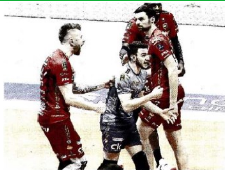
La gioia della Lube per la vittoria a Monza Sopra, un attacco di Civitanova durante Gara 4