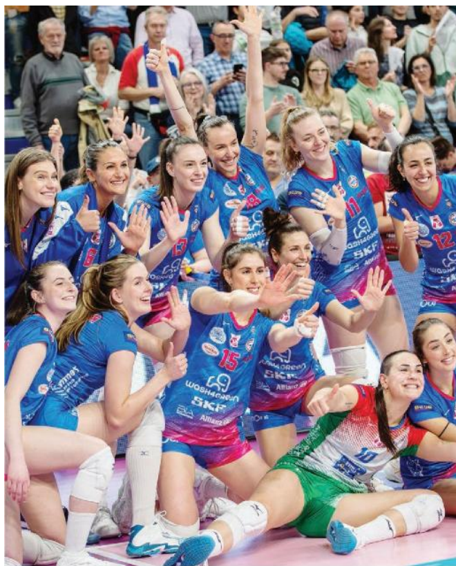
La festa delle giocatrici di Pinerolo per il sesto posto UNIONVOLLEY

PLAYOFF quarti di finale gara 1 27/03 ore 19.30 Conegliano-Roma, dir. Sky Sport; ore 20.30 Milano-Pinerolo, dir. Rai Play; Novara-Chieri, dir. VBT; Scandicci-Vallefoglia, dir. VBT