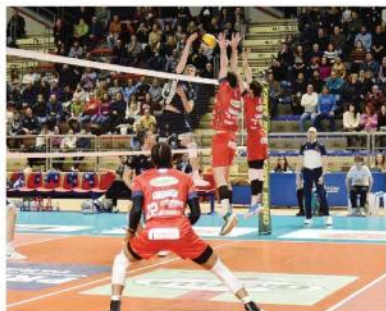
Théo Faure (24) schiaccia contro il muro di Taranto

Determinante nella rimonta (20 punti) dopo il primo set perso Nedeljkovic segna, Mazzone mura