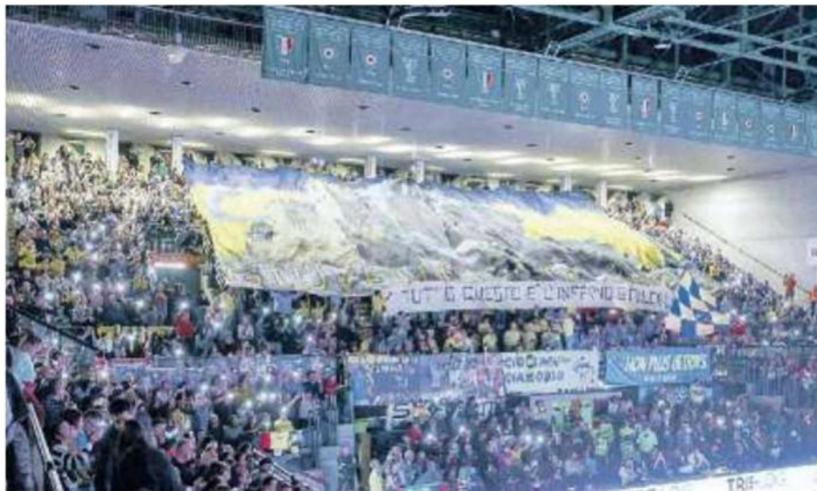
COREOGRAFIA Tifo alle stelle in Curva sud tutta gialloblù nel terzo sold-out stagionale del Palaverde

NOTE - Durata set: 29', 29', 25'. Totale: 1h32'. Prosecco Doc Imoco Volley Conegliano: battute vincenti 8, errate 10, muri 8, attacco 48%, ricezione 50% (perfetta 30%), errori 17. Allianz Vero Volley Milano: battute vincenti 6, errate 7, muri 5, attacco 35%, ricezione 48% (perfetta 20%), errori 17. MVP: Isabelle Haak. Spettatori: 5.344.