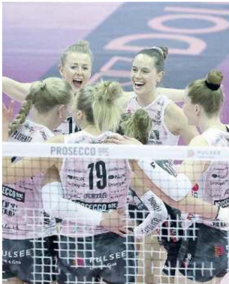
INVINCIBILI Per la Prosecco Doc è la 29 vittoria consecutiva

Ritaglio Stampa ad uso esclusivo del destinatario. Non riproducibile