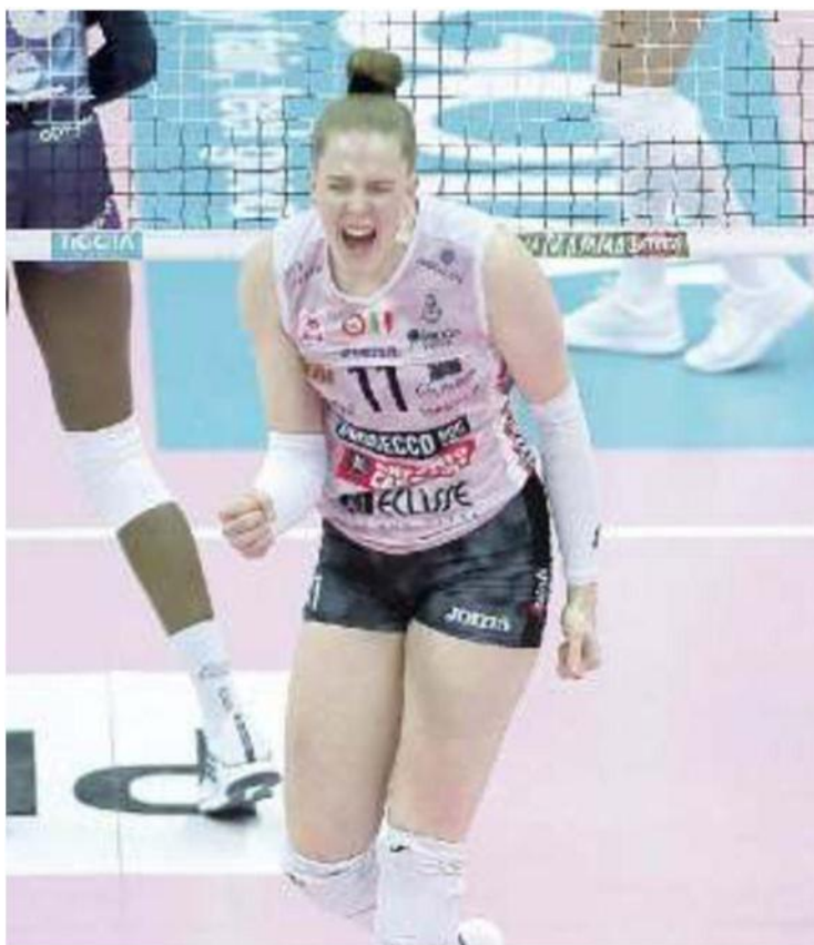
MVP Bella Haak, 20 punti e 54% in attacco nel duello con Egonu

Ritaglio Stampa ad uso esclusivo del destinatario. Non riproducibile