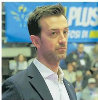
Coach Daniele Santarelli

Al suo arrivo al Palaverde assieme a Monica De Gennaro, Daniele Santarelli ha dovuto fruire dell'accompagnamento di uno steward per evitare l'assalto di alcune centinaia di tifosi assiepati all'ingresso delle squadre per strappare almeno una foto. «Era una magia già l'atmosfera iniziale. Sentivamo da tempo che