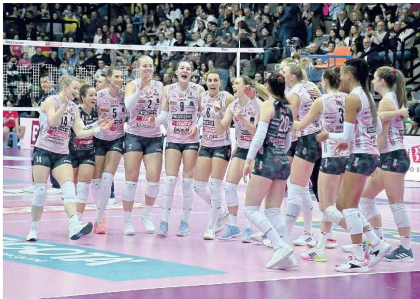
DOMINIO INCONTRASTATO La Prosecco Doc Imoco ha piegato anche l'Allianz per 3-0 in un'ora e mezza nello scontro al vertice in un Palaverde sold-out

Ritaglio Stampa ad uso esclusivo del destinatario. Non riproducibile