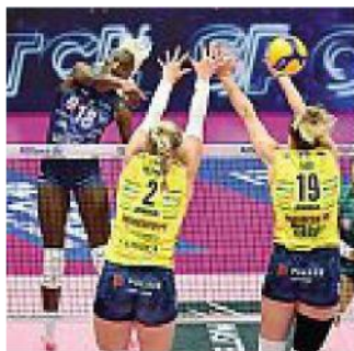
Ex Muro su Egonu all'andata (Lvf)

Dopo la Coppa Italia, con andata tra il 20 e il 21 febbraio e ritorno la settimana successiva, la squadra di Santarelli giocherà i quarti di Champions quasi certamente con il Vakif