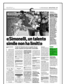
Superficie 2 %

ARTICOLO NON CEDIBILE AD ALTRI AD USO ESCLUSIVO DEL CLIENTE CHE LO RICEVE - DS4 - S.33018 - L.1623 - T.1623