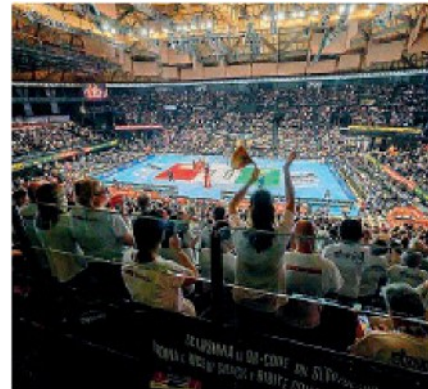
Unipol Arena Sold out in occasione della finale

■ La Coppa Italia a Bologna è stato un evento dai grandi numeri. Il pubblico della pallavolo ha risposto con la presenza alla Unipol Arena di oltre 16 mila spettatori nella due giorni (7.562 per le semifinali, 9.125 per la finale) per oltre 300 mila euro di incasso (circa 138 mila il sabato, 170 mila la domenica). Massiccia anche la visione da casa. Quasi 300 mila spettatori hanno seguito la finale su Rai Due, quasi 400 mila hanno complessivamente visto le due semifinali su Raisport. A questi vanno aggiunti tutti coloro che hanno guardato i tre match in streaming, sia su RaiPlay che su V-BTV, la piattaforma streaming di Volleyball World che trasmette la Superlega in tutto il mondo. Senza dimenticare tutte le TV partner della Lega Pallavolo Serie A che hanno trasmesso la Coppa Italia in diversi paesi in tutto il mondo.