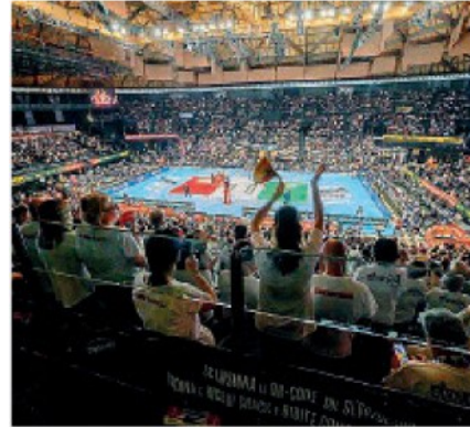
Unipol Arena Sold out in occasione della finale

■ La Coppa Italia a Bologna è stato un evento dai grandi numeri. Il pubblico della pallavolo ha risposto con la presenza alla Unipol Arena di oltre 16 mila spettatori nella due giorni (7.562 per le semifinali, 9.125 per la finale) per oltre 300 mila euro di incasso (circa 138 mila il sabato, 170 mila la domenica). Massiccia anche la visione da casa. Quasi 300 mila spettatori hanno seguito la finale su Rai Due, quasi 400 mila hanno complessivamente visto le due semifinali su Raisport. A questi vanno aggiunti tutti coloro che hanno guardato i tre match in streaming, sia su RaiPlay che su V-BTV, la piattaforma streaming di Volleyball World che trasmette la Superlega in tutto il mondo. Senza dimenticare tutte le TV partner della Lega Pallavolo Serie A che hanno trasmesso la Coppa Italia in diversi paesi in tutto il mondo.