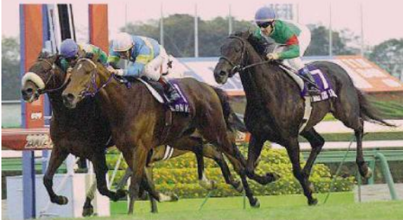
Show Japan Cup 2002: Falbrav e Dettori (primo piano a sinistra) precedono Sarafan (semicoperto) di un corto muso