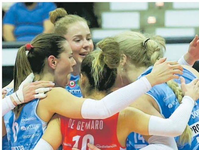
Le Pantere esultano dopo un punto in Champions League

ritrovare il Vakif a quasi due anni dalla finale di Lubiana è indubbio. E sarà un inedito vedere le formazioni di Santarelli e Guidetti affrontarsi per la prima volta su gare di andata e ritorno. Finora, tra Champions e Mondiale per club, le sfide sono sempre state solo in gara secca. Fin dalla finale del Palaverde del 2017, passando per Bucarest, Shiao-xing, Verona, Antalya e Lubiana, la storia dei questa rivalità può aggiungere nuovi affascinanti capitoli. Il Vakif ha dimostrato in questa stagione di essere battibile, ma anche Conegliano non è esente da imperfezioni. Tra Scandicci ed Eczacibasi si può riproporre l'abbinamento visto nel girone, dove le toscane hanno prevalso due volte. — M.C.