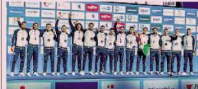
Sul podio il Settebello con la medaglia nella piscina Midost