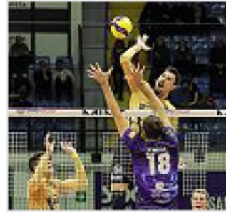
Blitz Vittoria esterna al tie break