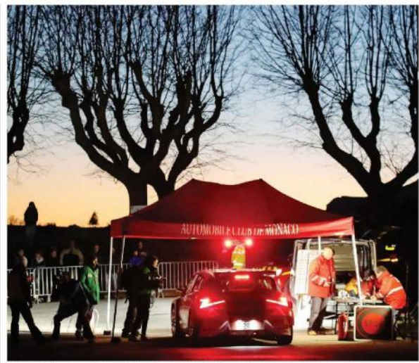
Il passaggio di un equipaggio a un punto di controllo durante una speciale di ieri MARTELLA

plicato calcolo da fare per individuare chi sarà il vincitore finale. Ci sarà una prima classifica il Sabato sera. Verranno assegnati i seguenti punteggi partendo dal vincitore ai primi 10 equipaggi classificati: 18-15-13-10-8-6-4-3-2-1. Le si complicano con i risultati della Domenica. Questi primi punti saranno assegnati ai soli equipaggi che completeranno il rally, quindi se la Domenica si ritirano, non prendono punti. Questi punti saranno assegnati all'equipaggio che nella generale il seguito. Questo perché nell'ultima tappa i piloti tiravano i remi in barca per l'esiguo numero di pneumatici da utilizzare e cercare di dare il meglio nella sola "Power Stage" finale. Lotto volte campione del mondo Sebastian Ogier è laconico: «Si rende complessa una cosa molto semplice come il punteggio di una vittoria».