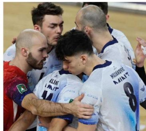
Giocatrici e staff dell'Allianz Vero Volley Milano. Nella foto a destra: i ragazzi del Mint Vero Volley Monza festeggiano dopo la vittoria ottenuta a Sofia