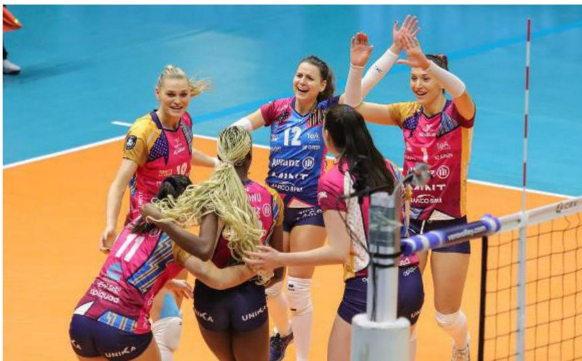
Milano cerca il bis contro le campionesse d'Europa di Istanbul dopo averle battute nel match d'andata