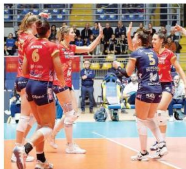
Le giocatrici di Chieri dopo il successo con il Chemik CEV.U