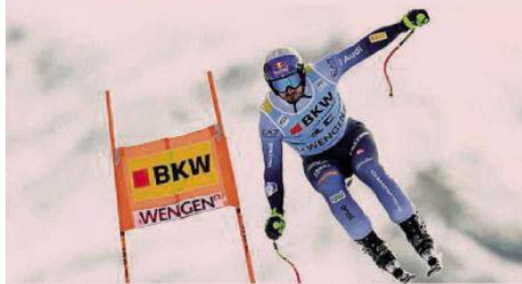
Due podi Dominik Paris, 34 anni, ieri in prova: a Wengen è stato secondo nel 2020 e terzo nel 2022