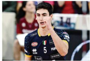
Alessandro Michieletto, 21 anni, 20 punti contro il Tours