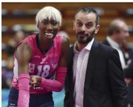
Paola Egonu (Milano) decisiva contro la sua ex squadra

VAKIFBANK ISTANBUL-ALLIANZ VERO VOLLEY MILANO 0-3 (17-25, 17-25 16-25)