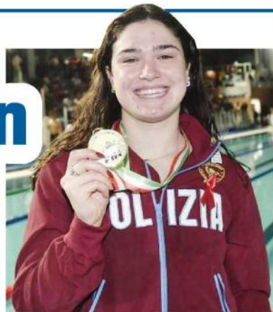
Benedetta Pilato (18 anni) con la medaglia dei 100 rana Sotto Thomas Ceccon (22 anni), 100 dorso per Parigi

THOMAS C'È. Ha faticato, forse un po' troppo, Thomas Ceccon che ha vinto i 100 dorso in 52'82,