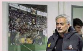
La Roma di Mourinho è impegnata in Europa League

Finisce il turno di Champions, non finiscono gli impegni europei per le italiane. Oggi Atalanta-Sporting Lisbona e Servette-Roma in Europa League, e Fiorentina-Genk in Conference: sfide che pesano, e che vi racconteremo in tempo reale con cronaca, pagelle, analisi, approfondimenti, le parole dagli spogliatoi. Ma da domani sarà già Serie A con Monza-Juve, e su gazzetta.it