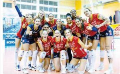
Festa dopo la vittoria in Serbia. Il ritorno a Torino il 7/12 FENERA '76

Pratica qualificazione ai quarti di finale di Cev Cup di fatto già evasa da parte della Reale Mutua Fenera Chieri '76 che ieri, grazie a una prova di grande concretezza e concentrazione, ha impiegato un'ora per espugnare il campo delle serbe dello Zeleznicar Lajkovac nell'andata degli ottavi. Uno 0-3 (11-25; 12-25; 13-25) mai in discussione, con le torinesi che non hanno lasciato alle avversarie possibilità di reazione. Le statistiche confermano la superiorità