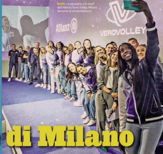
Selva La squadra e lo staff dell'Allianz Vero Volley Milano durante la presentazione