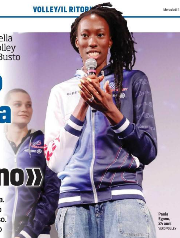
Paola Egonu, 24 anni VERO VOLLEY

«Felice di essere tornata in Italia. Mi sento carica e desidero tanto riprendere a giocare con il sorriso. Mi aspetto un anno di sorprese»