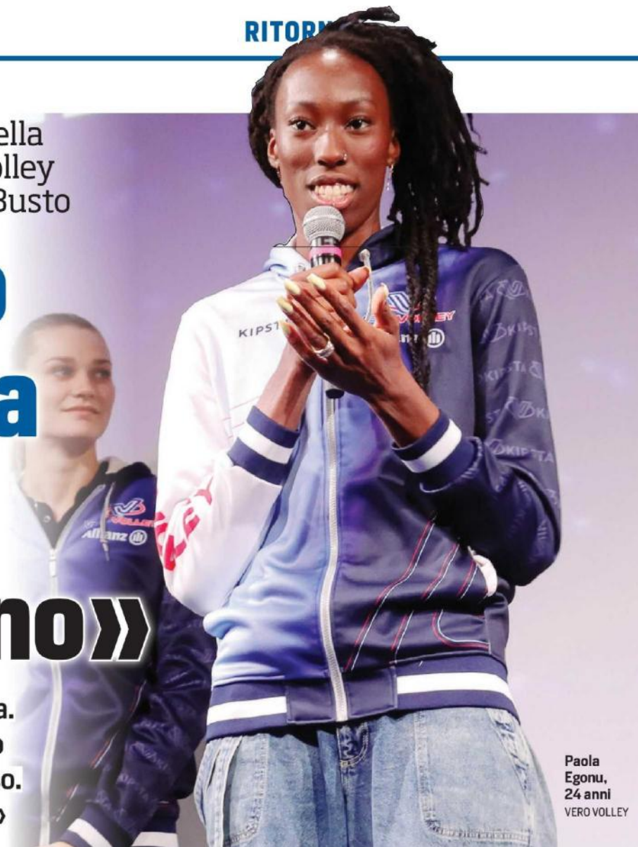
Paola Egonu, 24 anni VERO VOLLEY

«Felice di essere tornata in Italia. Mi sento carica e desidero tanto riprendere a giocare con il sorriso. Mi aspetto un anno di sorprese»