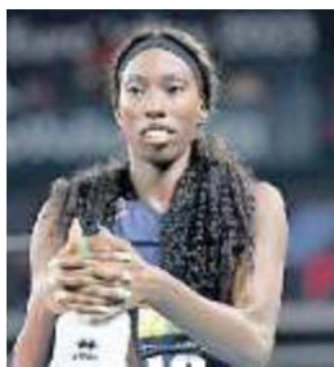
STELLARE Paola Egonu