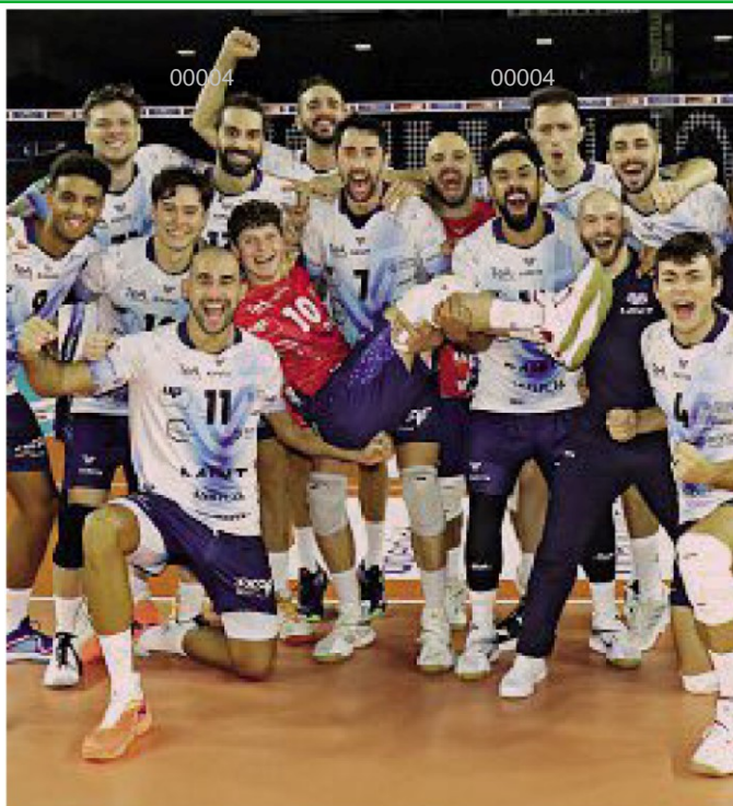
Festa L'esultanza dei giocatori di Monza dopo la netta vittoria su Civitanova

ARTICOLO NON CEDIBILE AD ALTRI AD USO ESCLUSIVO DEL CLIENTE CHE LO RICEVE - 4 - L.1620 - T.1620