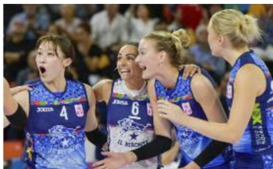
L'esultanza delle ragazze de Il Bisonte durante la gara

ESULTANZA Il match è stato equilibrato, Bergamo ha buttato nella mischia tutte le componenti della panchina, ma le bisontine sono state più lucide nei momenti decisivi