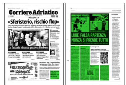
Superficie 46 %

ARTICOLO NON CEDIBILE AD ALTRI AD USO ESCLUSIVO DEL CLIENTE CHE LO RICEVE - 4