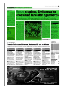
Superficie 37 %

● Martedì 31 ottobre e mercoledì 1 novembre a Biella la Supercoppa con Trento, Perugia, Piacenza e Civitanova