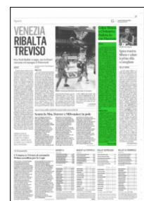
Superficie 8 %

ARTICOLO NON CEDIBILE AD ALTRI AD USO ESCLUSIVO DEL CLIENTE CHE LO RICEVE - 4