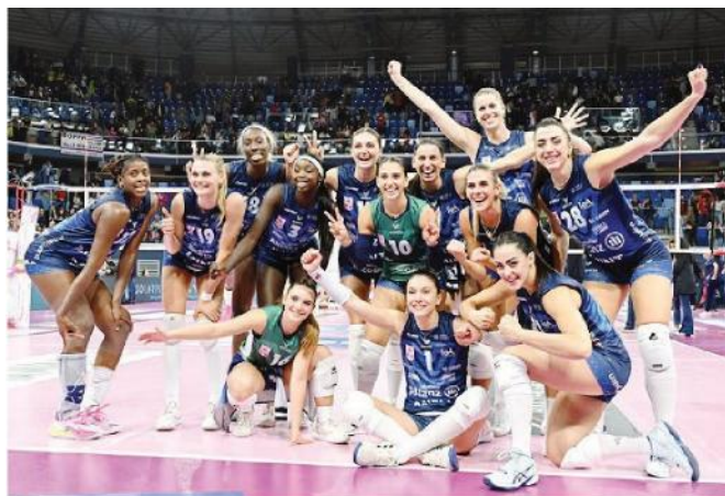
Foto di gruppo dopo la vittoria per l'Allianz Vero Milano GALBIATI