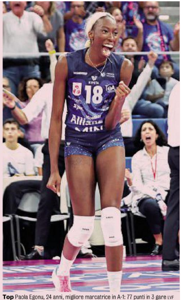
Top Paola Egonu, 24 anni, migliore marcatrice in A-1: 77 punti in 3 gare LVF