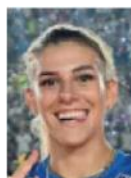
IN CAMPO Alessia Orro, 25 anni

Saranno circa 200 gli atleti che parteciperanno alla prima edizione del torneo di beach volley organizzato dalla campionessa Alessia Orro. Si parte oggi alle 16 negli impianti sportivi Il Nuraghe, a San Vero Milis. Come ha sottolineato la palleggiatrice dell'Italvolley e dell'Allianz Vero Volley Milano l'obiettivo è trasformare il torneo in un appuntamento fisso. La parte tecnica è stata curata dalla Sunvolley; in programma un torneo misto