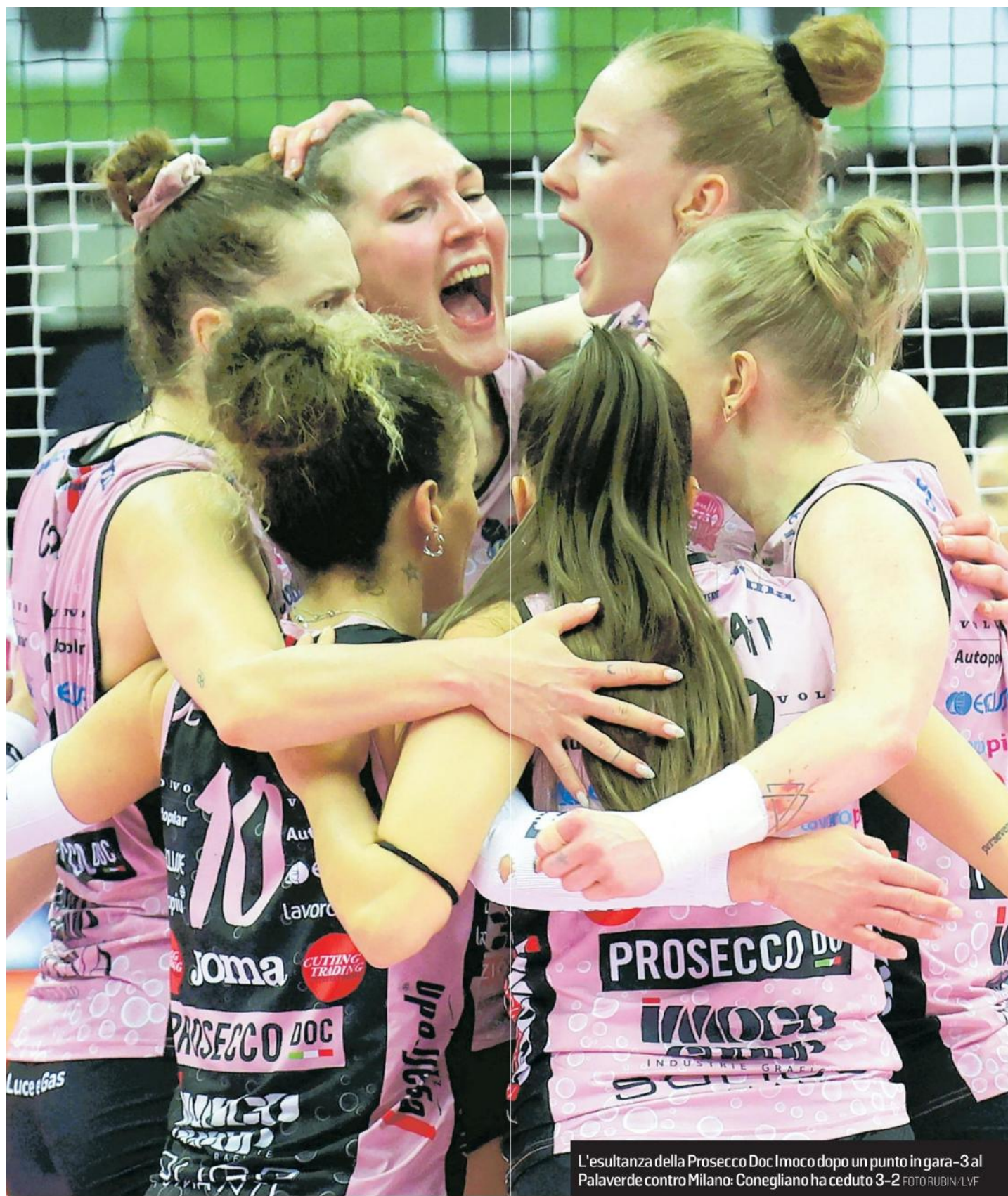
L'esultanza della Prosecco Doc Imoco dopo un punto in gara-3 al Palaverde contro Milano: Conegliano ha ceduto 3-2

Ritaglio Stampa ad uso esclusivo de destinatario. Non riproducibile