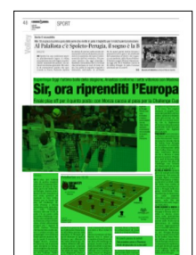
Superficie 60 %

ARTICOLO NON CEDIBILE AD ALTRI AD USO ESCLUSIVO DEL CLIENTE CHE LO RICEVE - 4