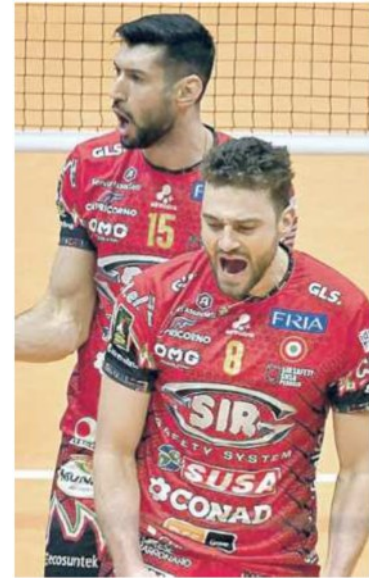
L'esultanza dei giocatori Sir

ARTICOLO NON CEDIBILE AD ALTRI AD USO ESCLUSIVO DEL CLIENTE CHE LO RICEVE - 4