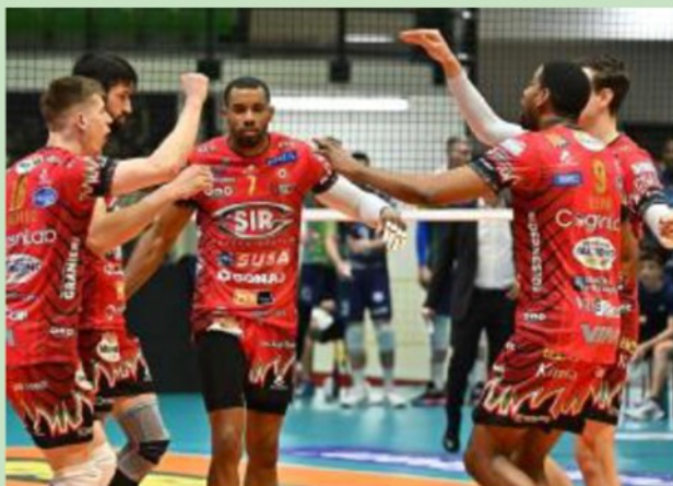
La Sir Safety Susa Perugia nella gara vinta contro Monza

La Sir Safety Susa Perugia sembra proprio aver assorbito la cocente delusione per essere stata esclusa dalla semifinale scudetto che molti davano già per scontata. Nella prima gara dei play off per il quinto posto ha infatti superato per 0-3 Monza, vincendo in maniera abbastanza netta i primi due parziali e imponendosi al vantaggio nel terzo. Trascinata da Leon ed Herrera, entrambi a segno con 15 punti, anche se l'MVP se l'è preso il palleggiatore della nazionale Giannelli che ha servito magistralmente i compagni realizzando peraltro 6 punti.