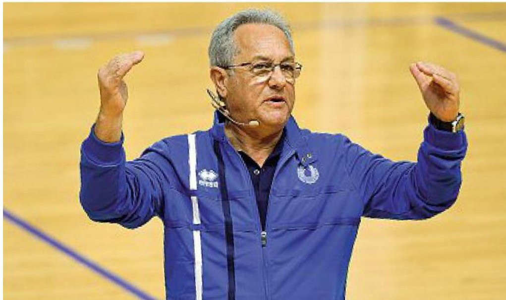
Mito Julio Velasco, 71 anni, due Mondiali vinti con l'Italia nel 1990 e 1994 e c.t. della Nazionale femminile nel 1997 e 1998