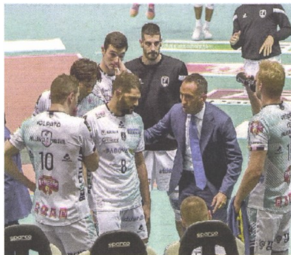
MISSIONE DIFFICILE C'è l'ostacolo Modena per i bianconeri di Cuttini

ENTRAMBE LE SQUADRE HANNO PERSO LA PRIMA SFIDA DEL "PLAY OFF QUINTO POSTO" CHE ASSEGNA IL PASS PER LA CHALLENGE CUP