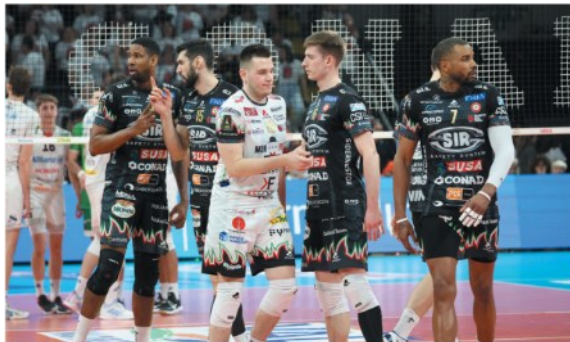
Delusione La Sir e Anastasi al termine della sconfitta con Milano. Ora serve la reazione a partire dalla gara di oggi a Monza dove gioca il temuto brasiliano Cachopa