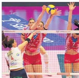
Milano in campo stasera

Mentre la Igor Novara inizia stasera la propria avventura nei playoff, le altre squadre sono già scese in campo lo scorso weekend. Infatti il calendario non permette momenti di pausa, poiché l'eventuale gara 5 della finale scudetto è fissata per il 15 maggio. Conegliano ha giocato ieri sera a Busto Arsizio dopo aver dominato il primo match. Stasera alle 20,30 è in programma Casalmaggiore-Milano, con le cremonesi che domenica hanno rischiato il colpaccio perdendo solo al tie-break. Domani alle 20,30 c'è Bergamo-Scandicci e le toscane hanno vinto agevolmente 3-0 il primo incontro. Per tutti la «bella» è fissata tra sabato e domenica, mentre sabato sera al Pala Igor le ragazze di Stefano Lavarini ospiteranno Chieri in gara 2 (eventuale bella lunedì a Chieri). Semifinali al via tra mercoledì 26 e giovedì 27 aprile. Alle 20,30 di stasera si disputano anche le due partite di ritorno del turno preliminare dei playoff di Challenge Cup: Pinerolo e Cuneo ricevono rispettivamente Vallefoglia e Firenze per allungare la serie e rinviare il verdetto alla bella. Marchigiane e toscane si sono infatti imposte nel primo atto. Chi passa troverà le quattro società eliminate dai quarti dei playoff scudetto. M.C. —