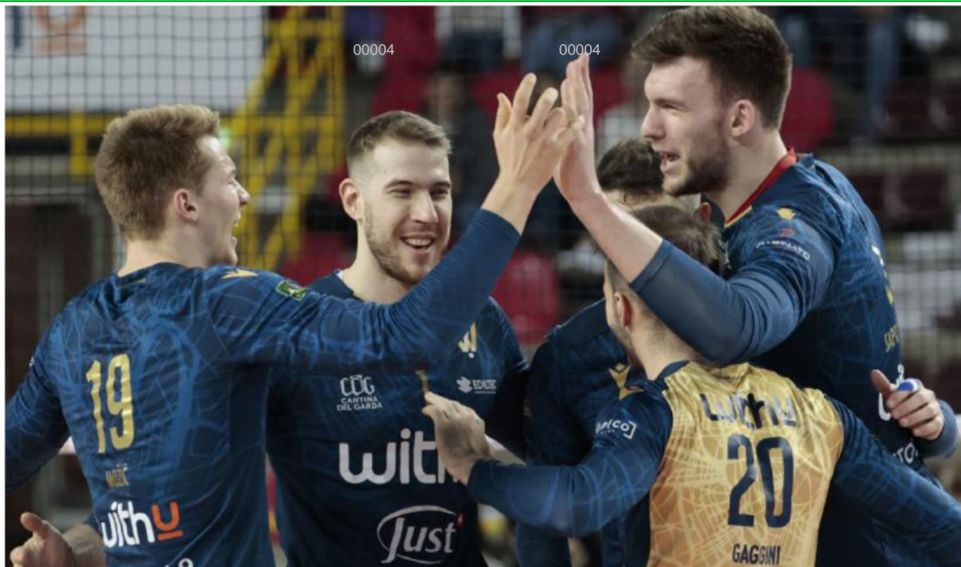
WithU Verona festeggia un punto nel match contro Padova

ARTICOLO NON CEDIBILE AD ALTRI AD USO ESCLUSIVO DEL CLIENTE CHE LO RICEVE - 4