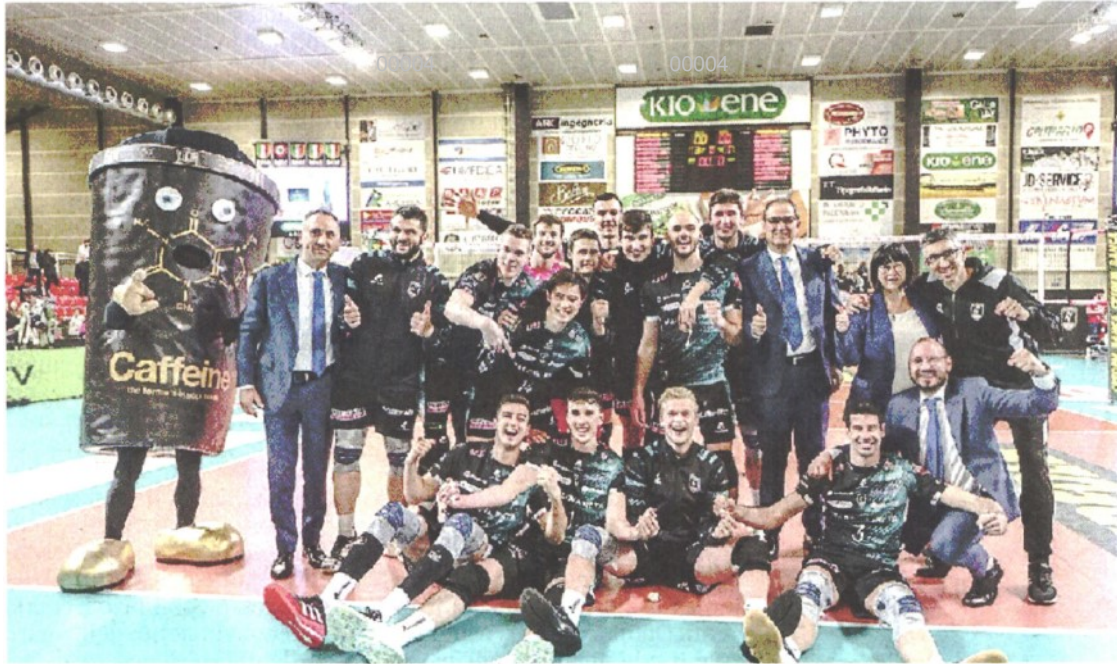
ESULTANZA Foto di gruppo per giocatori e staff della Pallavolo Padova dopo la vittoria su Taranto