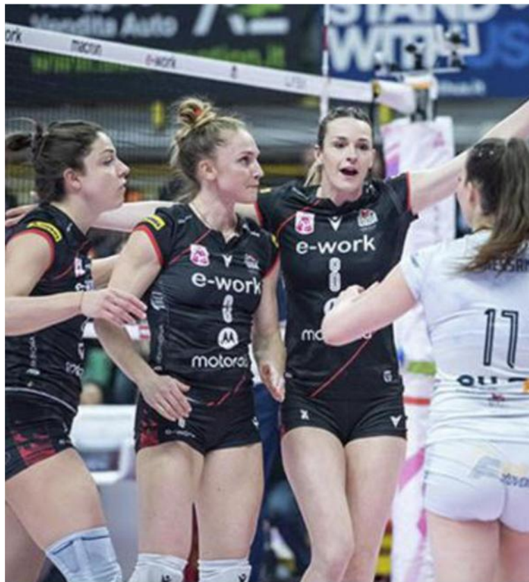
Busto è pronta ad affrontare i quarti playoff contro le pantere di Conegliano Una sfida quasi impossibile contro le venete che hanno chiuso al primo posto

Ritaglio Stampa ad uso esclusivo del destinatario. Non riproducibile