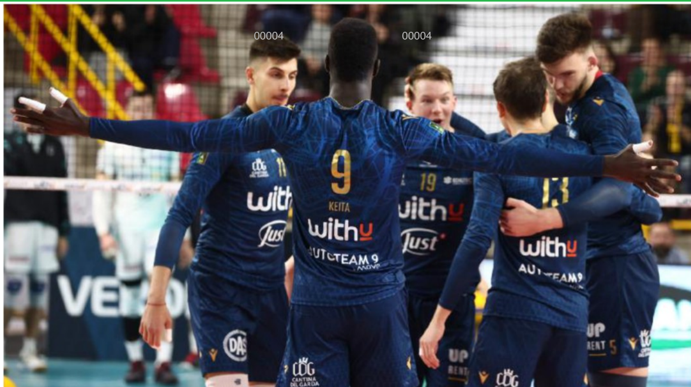
La stagione non è finita WithU Verona impegnata nei play off per il quinto posto

ARTICOLO NON CEDIBILE AD ALTRI AD USO ESCLUSIVO DEL CLIENTE CHE LO RICEVE - 4