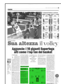
Superficie 10 %

ARTICOLO NON CEDIBILE AD ALTRI AD USO ESCLUSIVO DEL CLIENTE CHE LO RICEVE - 4 - L.1623 - T.1623