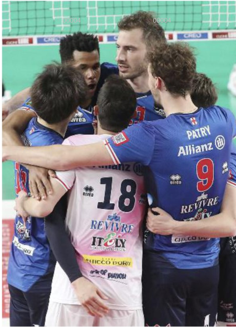
La Powervolley di Fusaro sta giocando le semifinali scudetto per la prima volta

ARTICOLO NON CEDIBILE AD ALTRI AD USO ESCLUSIVO DEL CLIENTE CHE LO RICEVE - 4 - L.1744 - T.1744