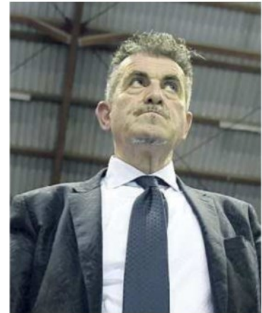
Il presidente Sir Gino Sirci

ARTICOLO NON CEDIBILE AD ALTRI AD USO ESCLUSIVO DEL CLIENTE CHE LO RICEVE - 4