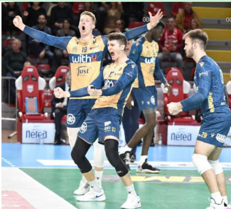
WithU Verona festeggia un punto