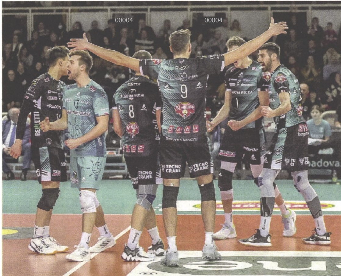
TURNO DECISIVO I bianconeri potrebbero festeggiare stasera la permanenza in Superlega

ARTICOLO NON CEDIBILE AD ALTRI AD USO ESCLUSIVO DEL CLIENTE CHE LO RICEVE - 4