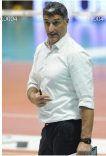
Coach Andrea Giani

ARTICOLO NON CEDIBILE AD ALTRI AD USO ESCLUSIVO DEL CLIENTE CHE LO RICEVE - 4