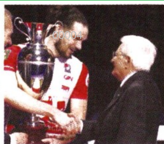
Con Mattarella Domenica Piacenza ha vinto la Coppa Italia

ARBITRI Vagni e Caretti. NOTE Spett. 1931. Durata set: 26', 20', 19', totale 65'. Lube Civitanova: battute sbagliate 11, vincenti 6, muri 8, errori 15. Milano: bs 11, v 2, m 4, e 21. Trofeo Gazzetta: 6 Bottolo, 5 Mergarejo, 4 Zaytsev, 3 Anzani, 2 Yant, 1 Chinenyeze. (m.g.)