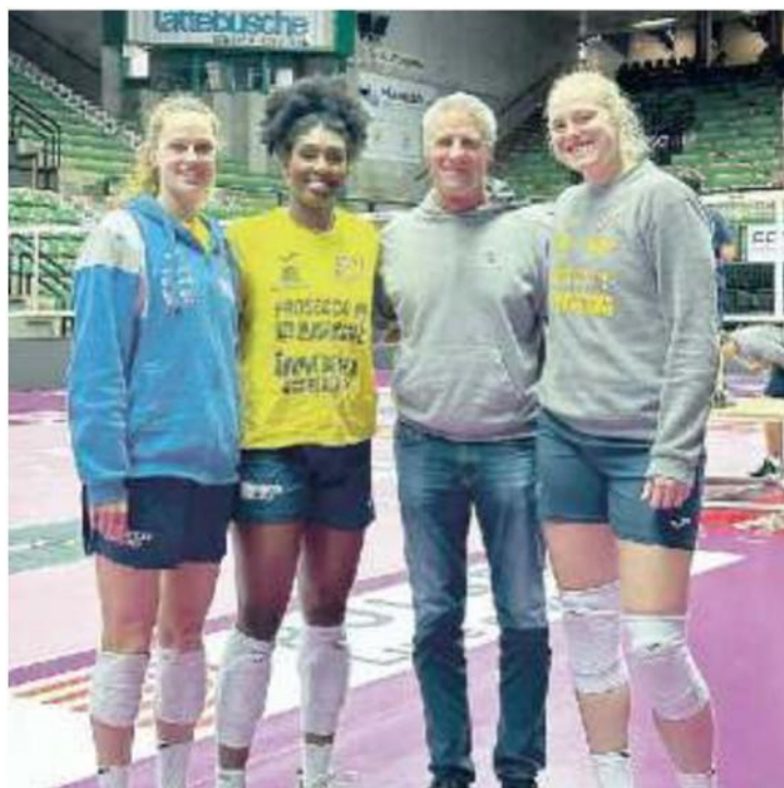
KARCH KIRALY Il coach campione del mondo in visita al Palaverde