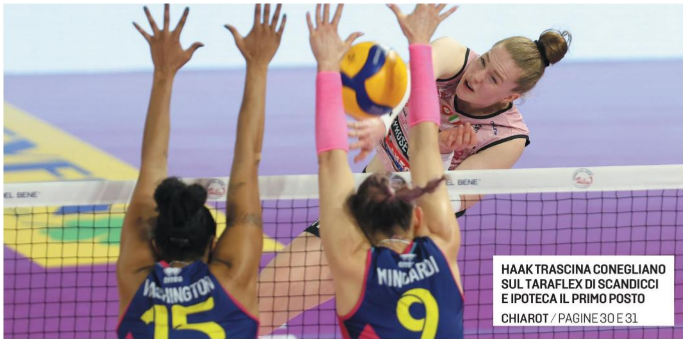
HAAK TRASCINA CONEGLIANO SUL TARAFLEX DI SCANDICCI E IPOTECA IL PRIMO POSTO CHIAROT / PAGINE 30 E 31