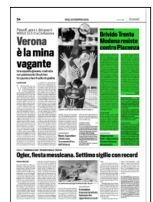
Superficie 19 %

TRENTINO-MONZA 3-2 (25-16, 25-21, 13-25, 18-25, 15-13) Itas: Sbertoli 3, Lavia 12, Lisinac 10, Kaziyski 11, Michieletto 19, Podrascanin 7, Pace (L), Laurenzano (L), D'Heer, Cavuto, Nelli 4, Dzavoronok 2. N.e. Berger, Depalma. All. Lorenzetti Vero Volley: Zimmermann, Davyskiba 10, Beretta 7, Grozer 29, Maar 14, Galassi 7, Hernandez 4, Szwarc 3, Krelling, Federici (L), Magliano. N.e. Pirazolli, Di Martino, Marttila. All. Eccheli Arbitri: Boris, Brancati. Note - durataset: 23', 29', 23', 25', 22'; tot: 122'