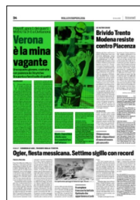
Superficie 40 %