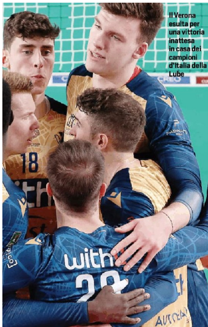
Il Verona esulta per una vittoria inattesa in casa dei campioni d'Italia della Lube