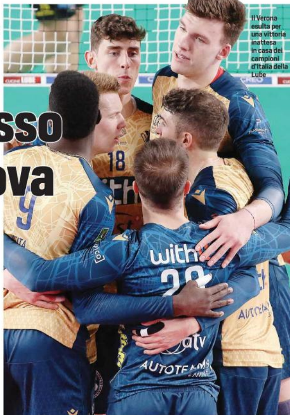
Il Verona esulta per una vittoria inattesa in casa dei campioni d'Italia della Lube

ERRORI EVITABILI. «Siamo mancati nei finali di set - dice Chiochi Belgini tecnico dei tricolori - commettendo errori evi-