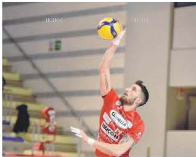
GRANDE FIDUCIA conquistata dalla società e dai compagni di squadra

ARTICOLO NON CEDIBILE AD ALTRI AD USO ESCLUSIVO DEL CLIENTE CHE LO RICEVE - 4