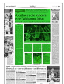
Superficie 36 %