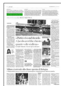
Superficie 1 %

ARTICOLO NON CEDIBILE AD ALTRI AD USO ESCLUSIVO DEL CLIENTE CHE LO RICEVE - 4 - L.1737 - T.1737