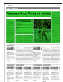
Superficie 33 %

Note: durata set 21', 25', 28', 28', per un totale di un'ora e 42'. Piacenza: battute vincenti 12, battute sbagliate 25, ricezione 36% (perf. 28%), attacco 55%, muri vincenti 7, errori 32; Padova: bv 6, bs 16, ric. 37% (perf. 16%), att. 44%, mv 4, err. 22; mvp: Romanò (Piacenza); spettatori 2.199, per un incasso di 19.786 euro.