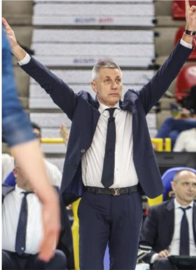
L'allenatore di WithU Verona Radostin Stoytchev

ARTICOLO NON CEDIBILE AD ALTRI AD USO ESCLUSIVO DEL CLIENTE CHE LO RICEVE - 4