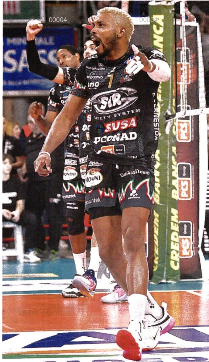
Nuovo look Il cubano Herrera festeggia il 22° successo in Serie A BENDA

ARTICOLO NON CEDIBILE AD ALTRI AD USO ESCLUSIVO DEL CLIENTE CHE LO RICEVE - 4 - L.1615 - T.1615