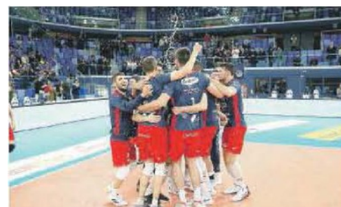
FESTEGGIAMENTI Esultanza nonostante la sconfitta