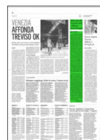
Superficie 8 %

ARTICOLO NON CEDIBILE AD ALTRI AD USO ESCLUSIVO DEL CLIENTE CHE LO RICEVE - 4