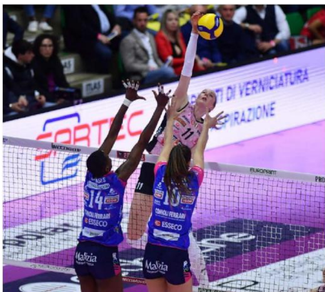
ATTACCO Haak sul muro Carcaces-Chirichella

ARBITRO: Brancati di Spoleto e Curto di Gorizia. NOTE: Spettatori: 5344.