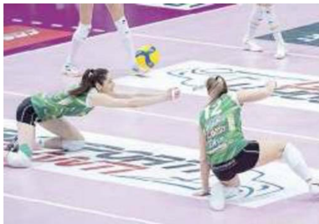
La Megabox Vallefoglia in una fase difensiva

Ritaglio Stampa ad uso esclusivo del destinatario. Non riproducibile