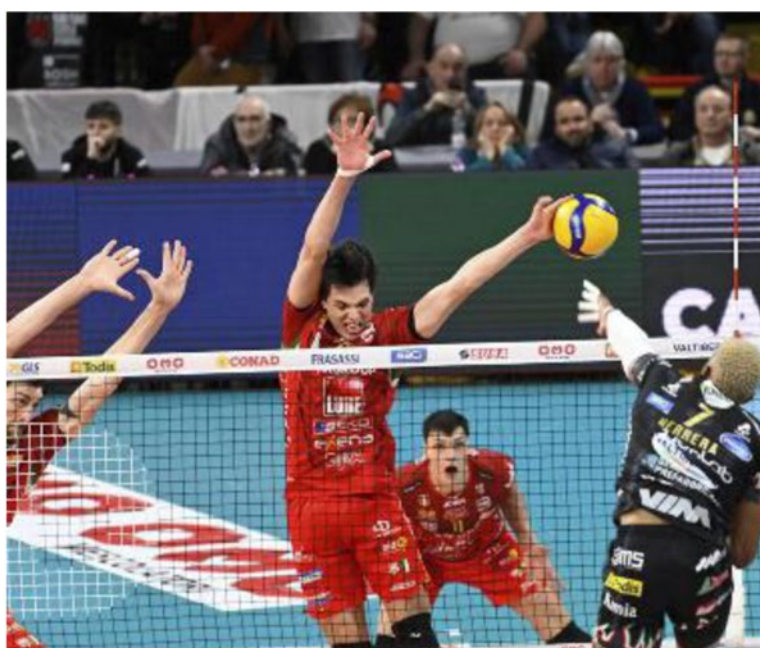
Bottolo a muro contro Herrera: si è chiusa la regular season

Il campionato proseguirà con la prossima fase