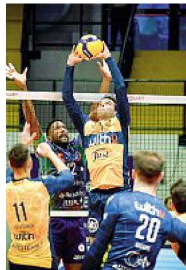
Dinamico Alzata di Cortesia