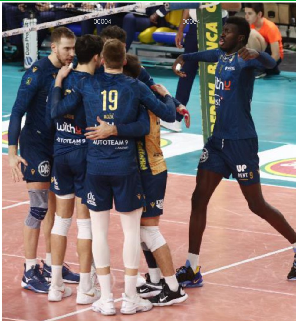
Avanti con fiducia Meno ansie per WithU dopo il raid a Monza: sono quattro i turni al termine della regular season

ARTICOLO NON CEDIBILE AD ALTRI AD USO ESCLUSIVO DEL CLIENTE CHE LO RICEVE - 4