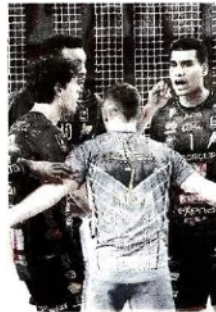
Sopra, la gioia della Lube per la vittoria su Cisterna