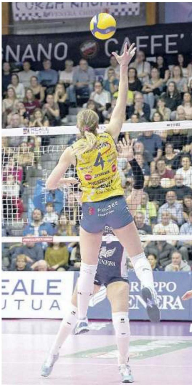
CLASSE 2000 Squarcini, 17 punti, ormai una garanzia per le gialloblu