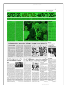
Superficie 34 %

Emma Siena-Lube Civitanova; Gas Sales Piacenza-Allianz Milano; Itas Trentino-Sir Safety Perugia; Kioene Padova-Withu Verona; Leo Shoes Modena-Prisma Taranto; Top Volley Cisterna-Vero V.Monza