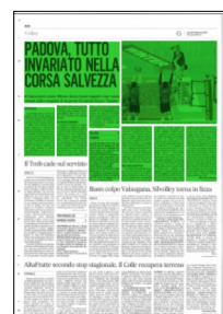
Superficie 37 %