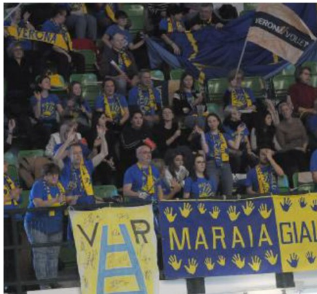
Tanti i tifosi gialloblù all'Arena di Monza per sostenere Verona

ARTICOLO NON CEDIBILE AD ALTRI AD USO ESCLUSIVO DEL CLIENTE CHE LO RICEVE - 4