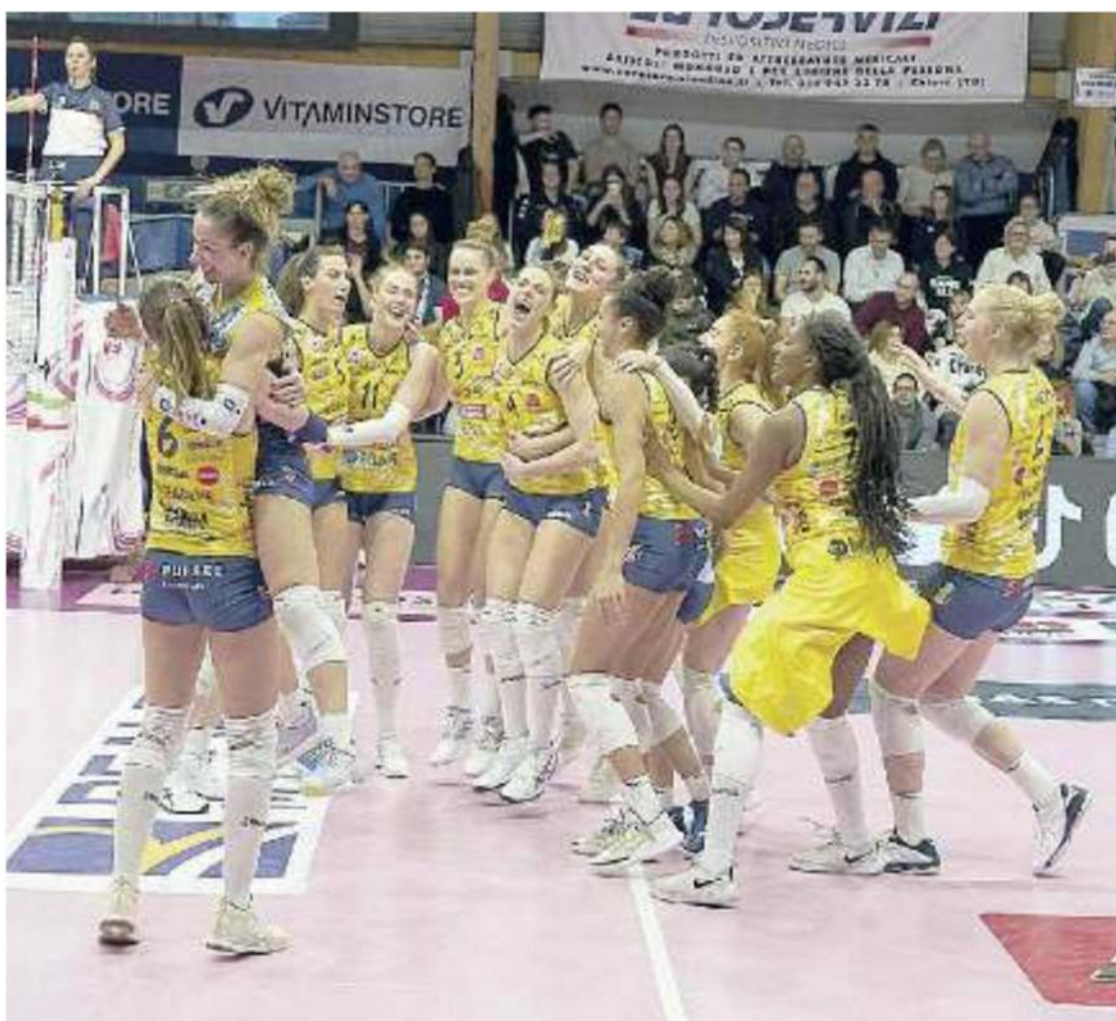
LA SUPREMAZIA Nonostante percentuali non brillantissime come sono solite fare, le pantere hanno dimostrato di essere compatte nei momenti più difficili come ieri sera a Chieri

Ritaglio Stampa ad uso esclusivo del destinatario. Non riproducibile