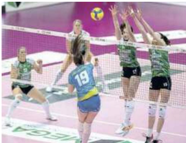
La Megabox Vallefoglia a muro contro Pinerolo