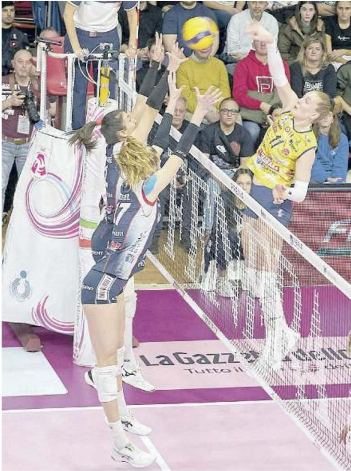
LA MIGLIORE La fuoriclasse svedese ha messo a terra 31 punti: è lei l'Mvp della partita

Ritaglio Stampa ad uso esclusivo del destinatario. Non riproducibile