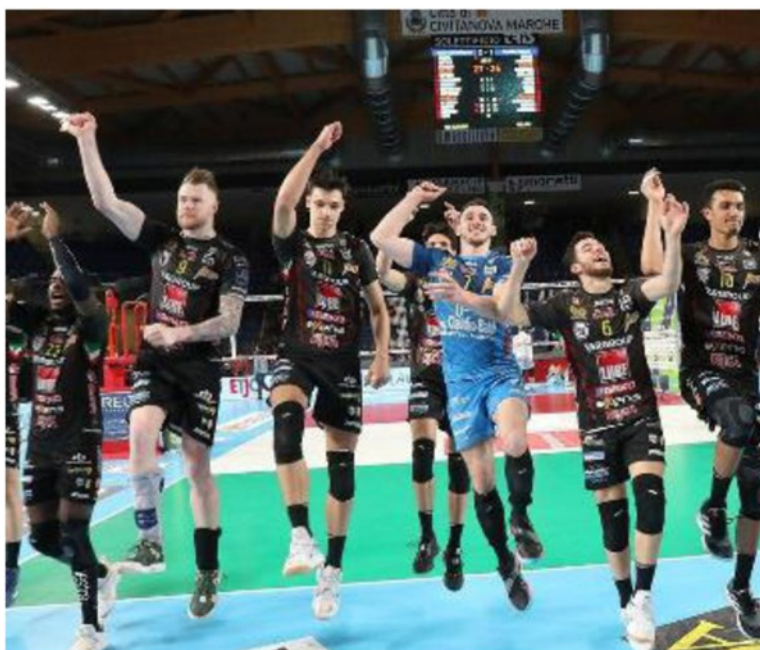
Festa sotto le tribune davanti ai tifosi dopo la vittoria