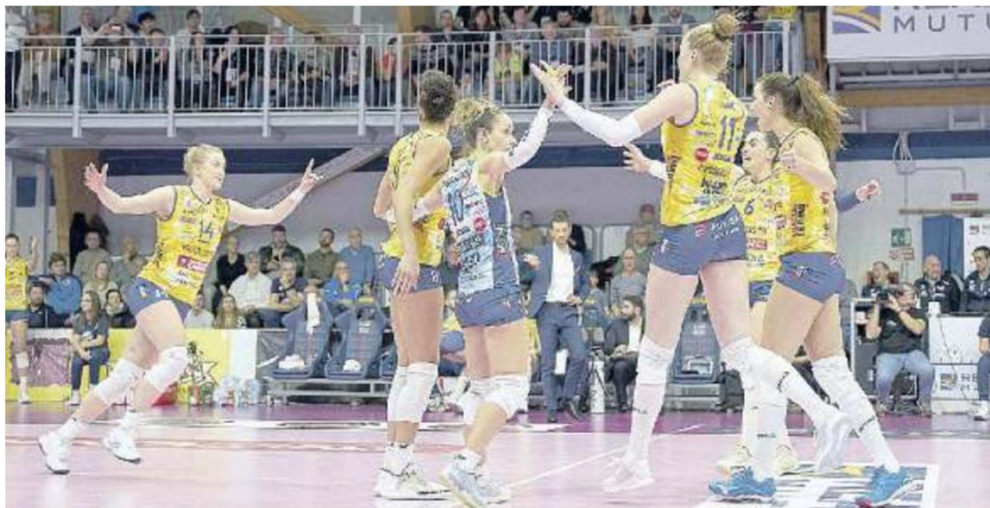
LE PIÙ FORTI La Prosecco Doc è stata trascinata ancora una volta da Haak, ma brillano Squarcini, Wolosz e De Gennaro