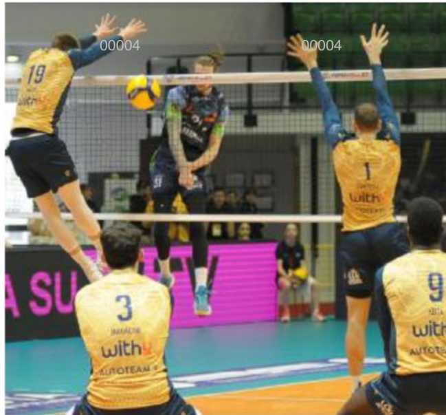
Arthur Szwarz in attacco contrastato da Rok Mozic