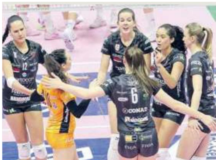
Il gruppo della Bartoccini