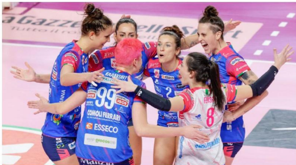
VITTORIA DUE PUNTI Per le ragazze novaresi nella sfida al Palalgor con Busto