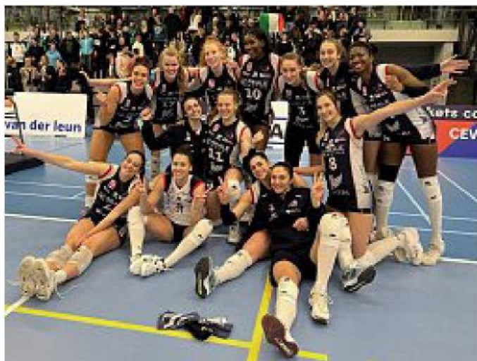
Le ragazze del Fenera Chieri festeggiano il successo nettissimo in Olanda