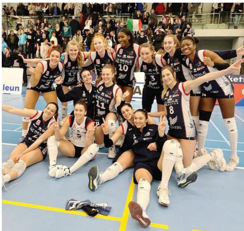
Le ragazze di Chieri festeggiano la settima meraviglia in Challenge Cup (CHIERI76)

Ritaglio Stampa ad uso esclusivo del destinatario. Non riproducibile