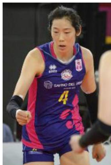
La cinese Zhu Ting è stata la migliore realizzatrice nella sfida di ieri