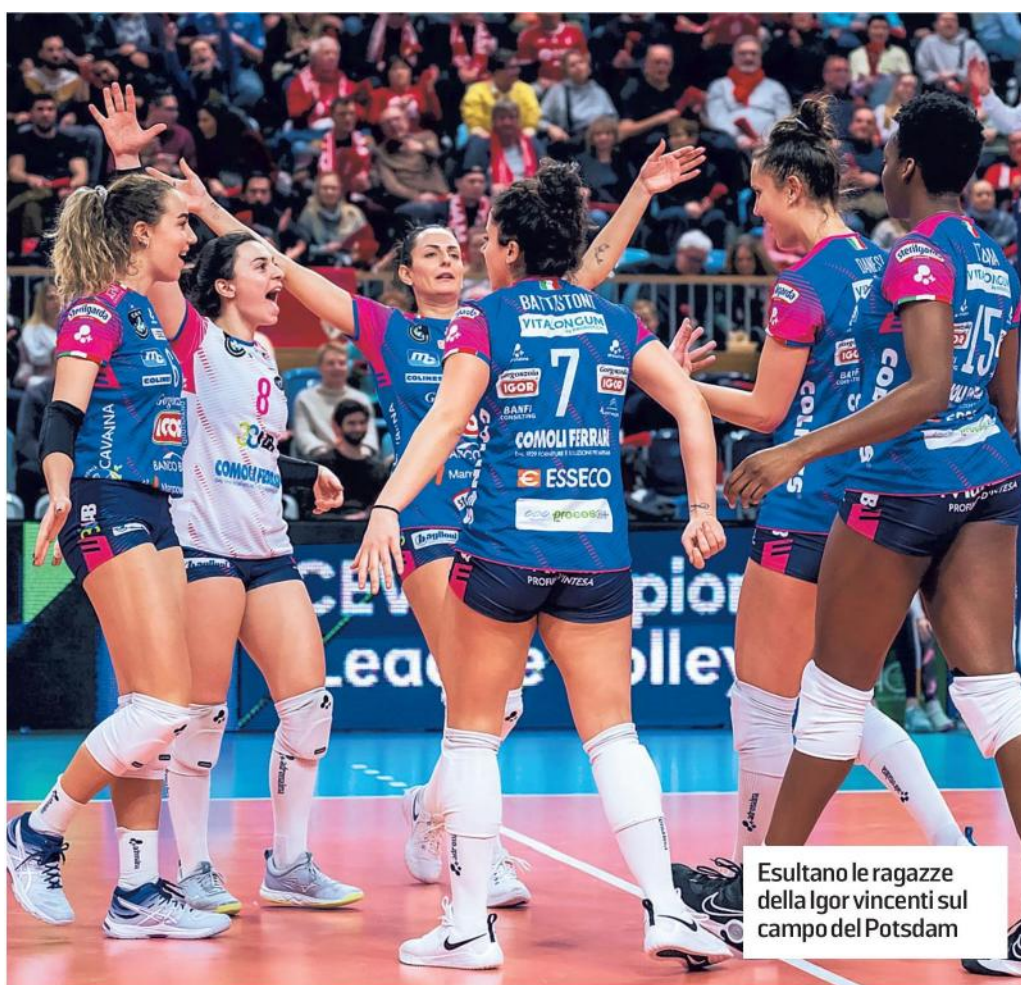
Esultano le ragazze della Igor vincenti sul campo del Potsdam

Ritaglio Stampa ad uso esclusivo del destinatario. Non riproducibile