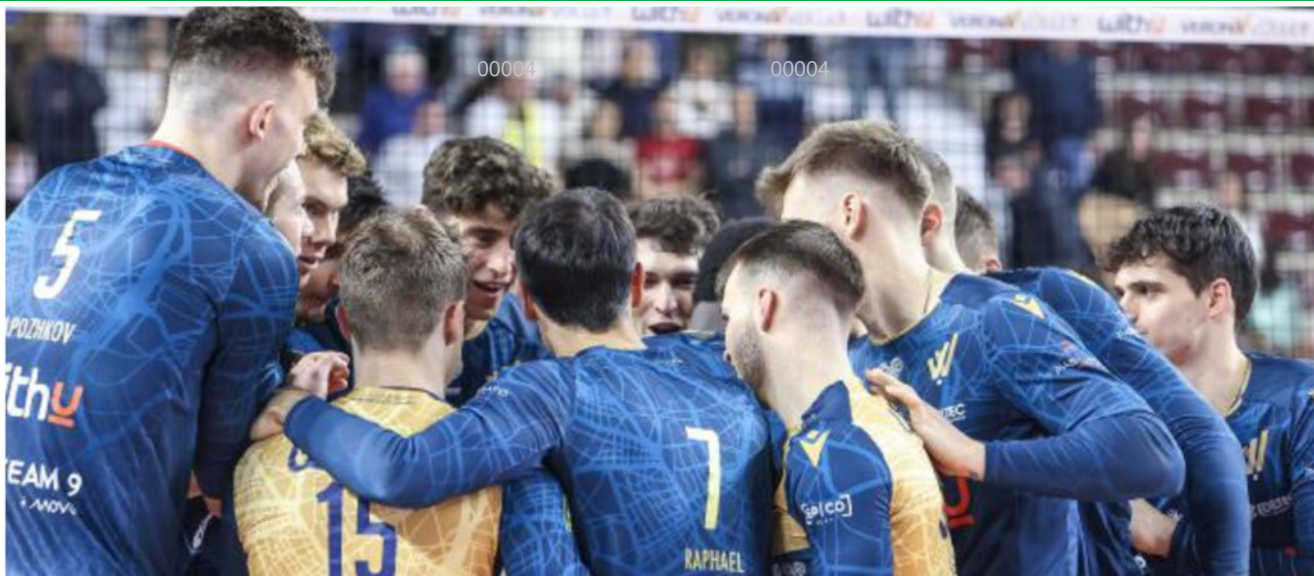
WithU Verona prima della sfida contro Milano

ARTICOLO NON CEDIBILE AD ALTRI AD USO ESCLUSIVO DEL CLIENTE CHE LO RICEVE - 4