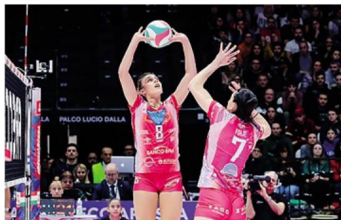
Due immagini della sfida contro Conegliano a Casalecchio di Reno