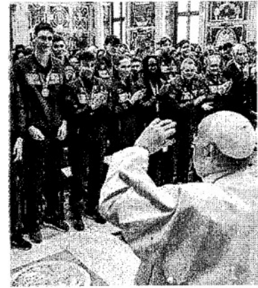
L'incontro con il Papa

ARTICOLO NON CEDIBILE AD ALTRI AD USO ESCLUSIVO DEL CLIENTE CHE LO RICEVE - 4