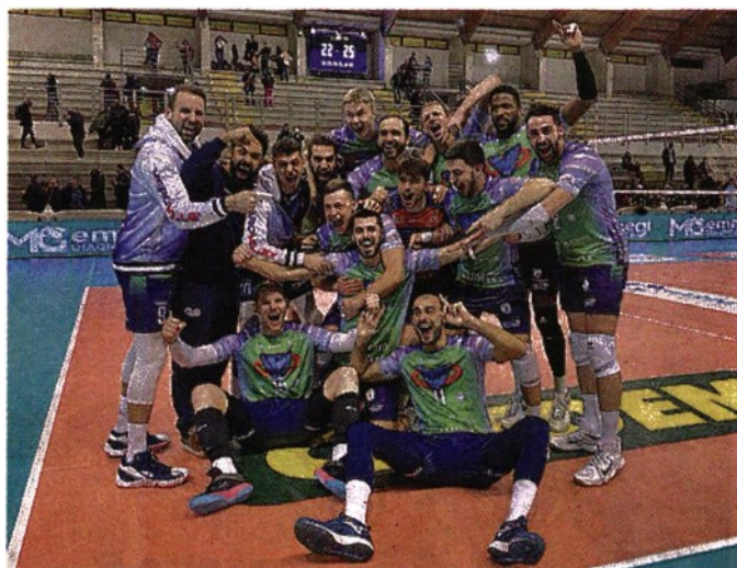
In festa Il Vero Volley sbanca il palasport di Cisterna e ipotoca i playoff

T.G.: 6 Szwarc, 5 Maar, 4 Sedlacek, 3 Zimmermann, 2 Galassi, 1 Gutierrez.