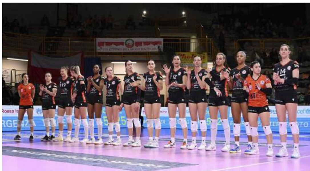
Le ragazze della rosa della Cbf Balducci schierate al fischio d'inizio nel match casalingo contro la forte Vero Volley Milano, sotto l'esultanza di gruppo dopo un punto: è arrivata la nona sconfitta consecutiva

Il colpo non è facile da assorbire, ma si ricomincia. Dopo una fase equilibrata Milano allunga il passo (10-15) e quel vantaggio viene conservato fino alla fine anche se le locali si rifanno sotto, ma le avversarie alla fine tagliano il traguardo (21-25).