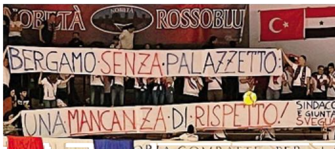
Lo striscione sulla questione palazzetto esposto dai tifosi rossoblù