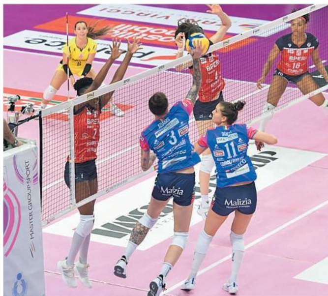
Una fase della partita di ieri giocata a Bergamo e persa dalla Igor

I motivi? Si parla genericamente di «ripetute violazioni delle regole basilari» (si presume si tratti di episodi gra-