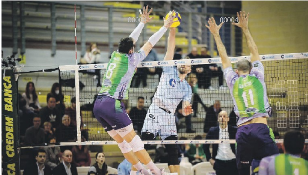
Alcuni momenti della sfida giocata ieri al palasport di Cisterna tra la Top Volley e Vero Volley Monza