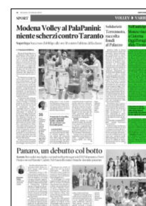
Superficie 8 %

Classifica: Perugia 54, Trento 35, Modena 35, Civitanova 30, Verona 27, Piacenza 27, Monza 27, Milano 26, Cisterna 23, Padova 15, Siena 14, Taranto 14. ●