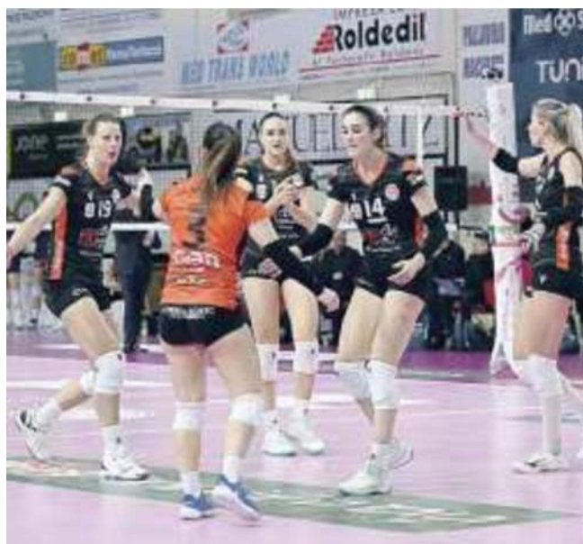
La Balducci Macerata non è riuscita a fermare Milano

Ritaglio Stampa ad uso esclusivo del destinatario. Non riproducibile