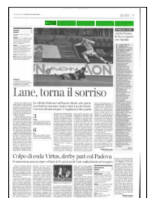
Superficie 2 %

ARTICOLO NON CEDIBILE AD ALTRI AD USO ESCLUSIVO DEL CLIENTE CHE LO RICEVE - 4 - L.1809 - T.1809