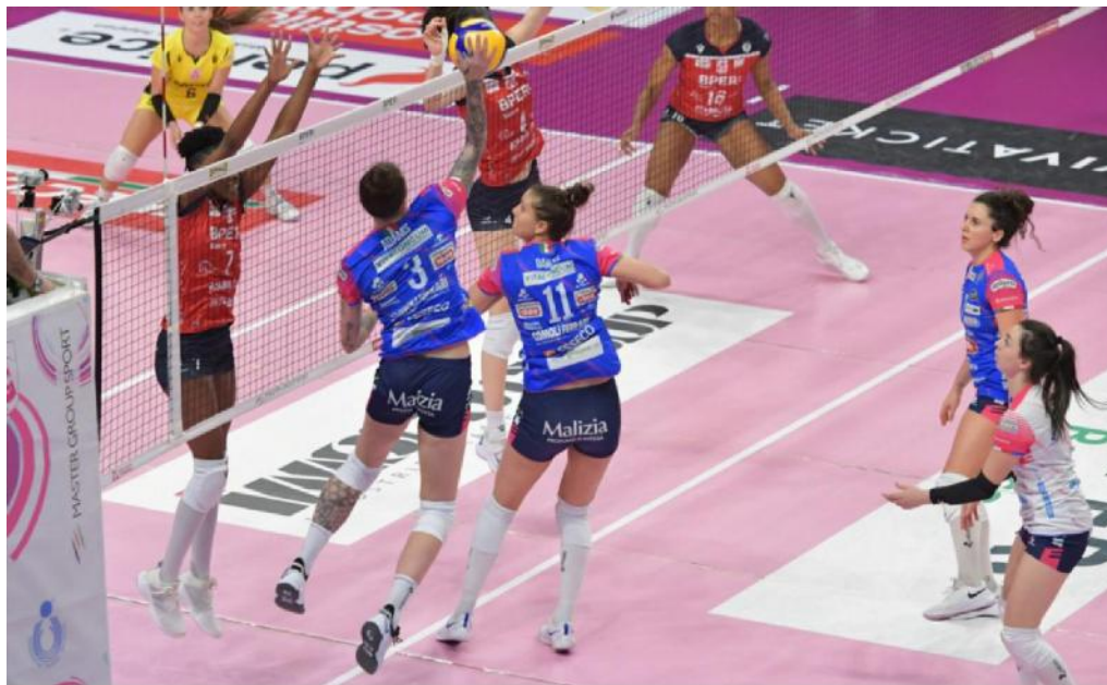
AL PALAINTRED Le novaresi sono incappate in una prestazione da dimenticare

Ritaglio stampa ad uso esclusivo del destinatario, Non riproducibile