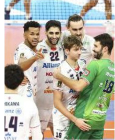
Milano con 26 punti in classifica sfida in trasferta Piacenza a quota 27