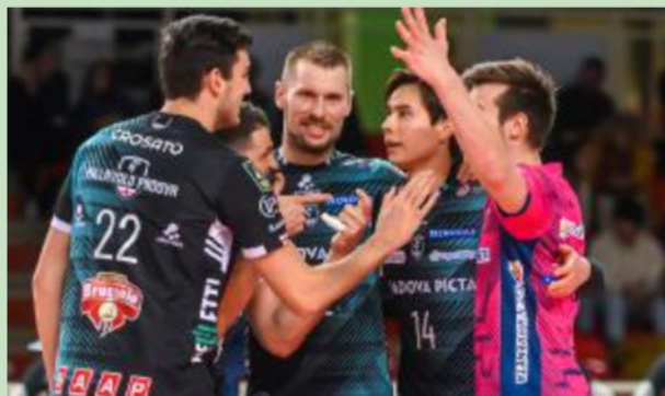
Foto di squadra Padova festeggia un punto

Allontanatasi, con la sconfitta di domenica scorsa a Milano, contro l'Allianz, la possibilità di restare ancora in corsa per play off, Padova deve ora guardarsi alle spalle perché il suo obiettivo primario è quello di salvarsi. Decima a quota 15, la compagine bianconera è infatti tallonata in graduatoria da Siena e Taranto, entrambe sotto di appena un punto e che si affronteranno peraltro tra una settimana per cui almeno una delle due muoverà la classifica. Oltretutto, da qui fino al termine della regular season, non ha più scontri diretti con un calendario per niente agevole visto che, dopo Verona, il sestetto patavino giocherà in trasferta a Monza, poi ospiterà Trento e andrà infine a far visita a Piacenza. Chiaro quindi che oggi dovrà cercare la vittoria, confidando sull'apporto del pubblico, per non dover giocarsi magari la permanenza in SupeLega l'ultima giornata. «Purtroppo a Milano siamo mancati in