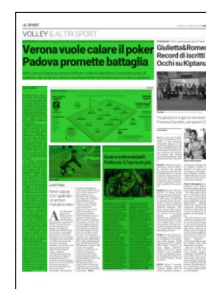
Superficie 48 %