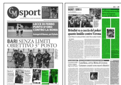
Superficie 23 %

«Siamo entrati nel momento clou della stagione», le parole del 34enne lombardo. «Siamo consapevoli che ogni domenica sarà una battaglia, una finale. Ci stiamo allenando cercando di portare in palestra quella cattiveria e determinazione che dovremo scatenare durante la partita. Modena è un top club, è scontato che per riuscire a metterla in difficoltà servirà la gara perfetta, cominciando proprio dal fondamentale della battuta. Dovremo dare tutto: