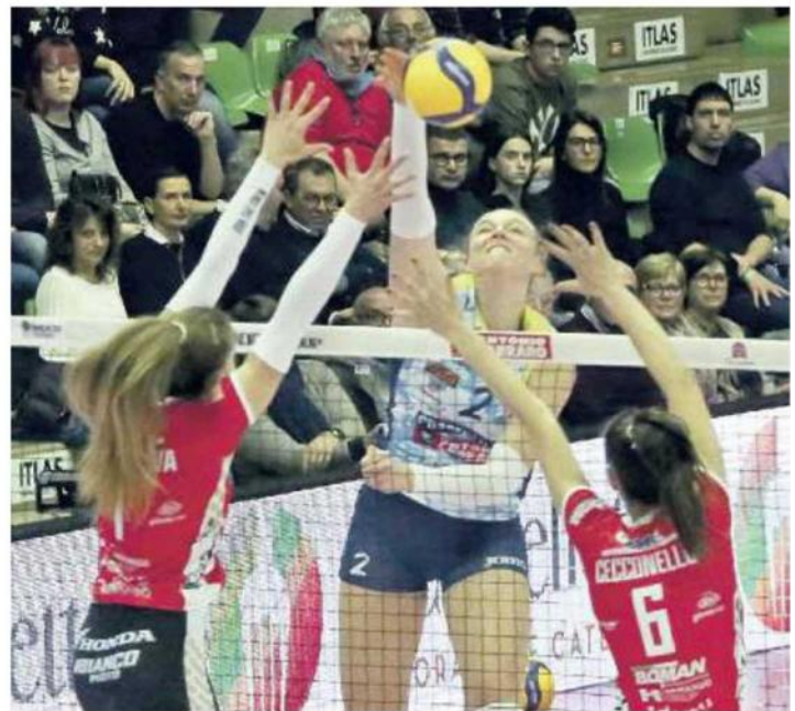
AL PALAVERDE Con la vittoria conquistata ieri contro le "gatte" di Cuneo, la Prosecco Doc sale a 49 punti in classifica con soltanto 13 set concessi alle avversarie in 19 partite