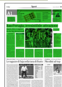
Superficie 42 %

Arbitri: Cappello (Siracusa), Zanussi (Treviso)