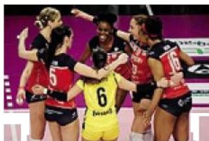
La gioia rossoblù