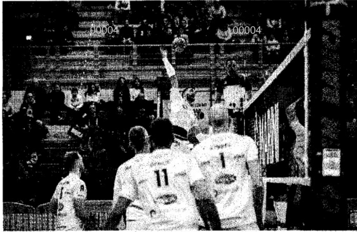
TOP VOLLEY Sedlacek in un'azione di gioco in attacco

ARTICOLO NON CEDIBILE AD ALTRI AD USO ESCLUSIVO DEL CLIENTE CHE LO RICEVE - 4