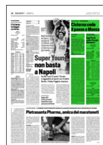
Superficie 19 %

ARTICOLO NON CEDIBILE AD ALTRI AD USO ESCLUSIVO DEL CLIENTE CHE LO RICEVE - 4 - L.1849 - T.1849