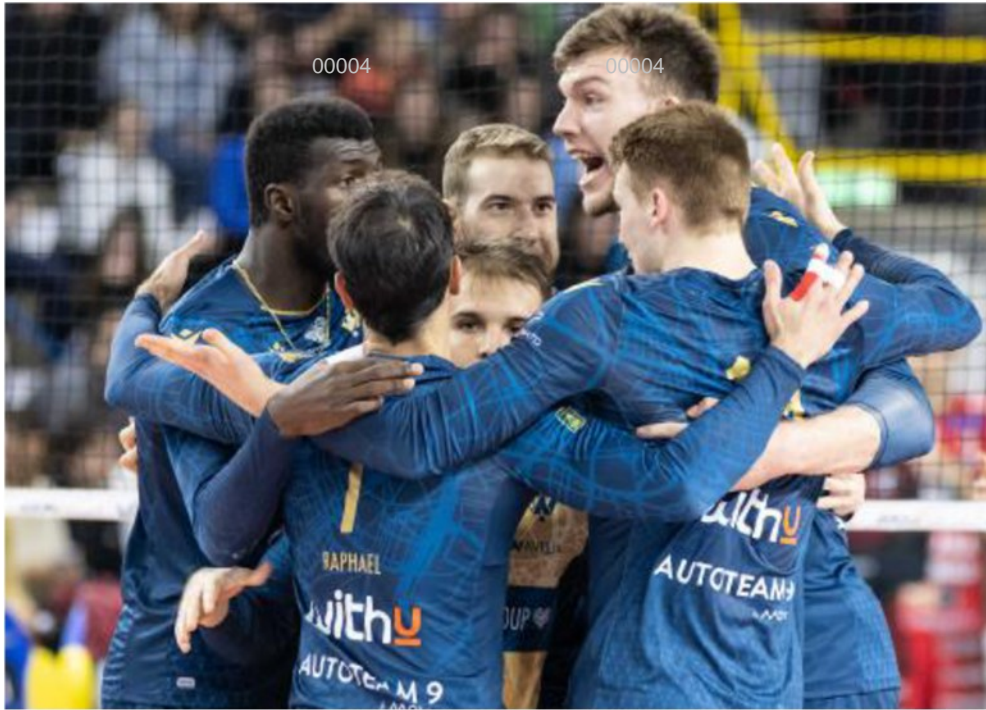
WithU Verona festeggia un punto SERVIZIO FOTOEXPRESS ZATTARIN