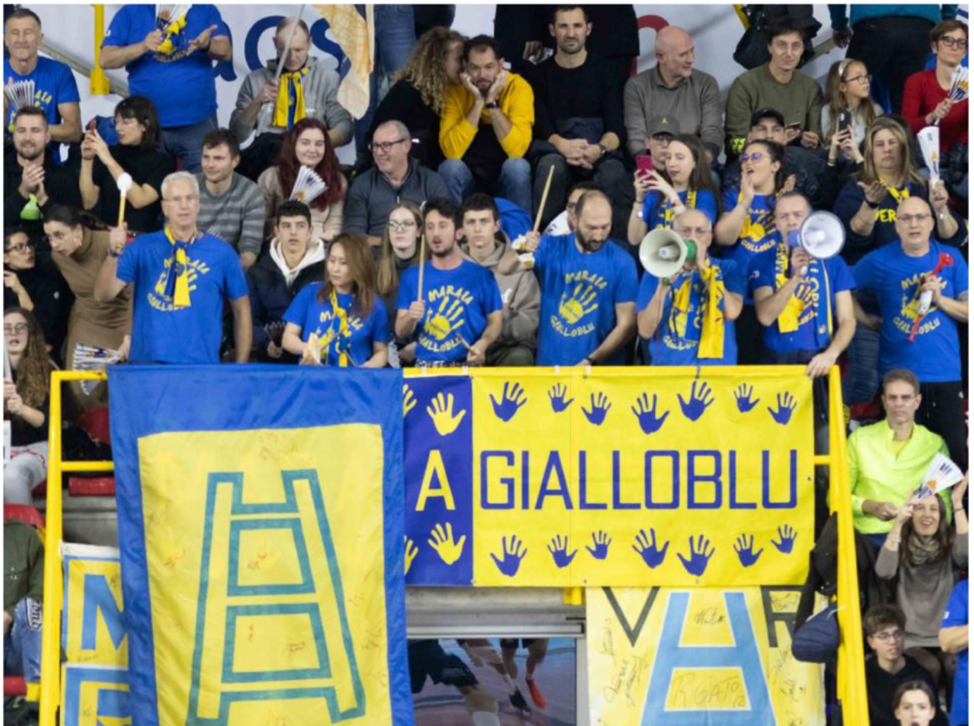
Una grande festa dello sport al palazzetto con 4688 persone sugli spalti, qui la curva della Maraia gialloblù

ARTICOLO NON CEDIBILE AD ALTRI AD USO ESCLUSIVO DEL CLIENTE CHE LO RICEVE - 4