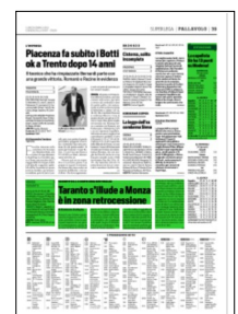
Superficie 18 %

ARTICOLO NON CEDIBILE AD ALTRI AD USO ESCLUSIVO DEL CLIENTE CHE LO RICEVE - 4 - L.1603 - T.1603