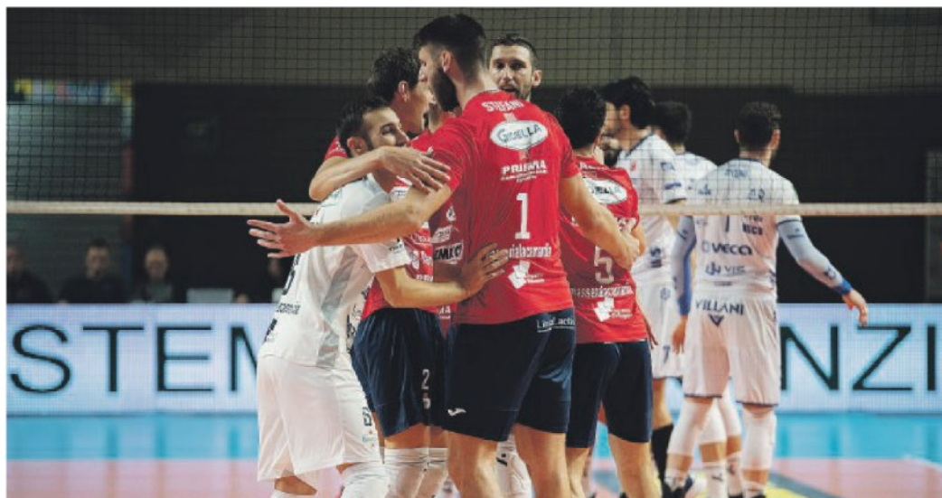
KO Una battaglia di oltre due ore, Prisma sconfitta a Milano

CLASSIFICA -Perugia 42; Modena 29; Civitanova 26; Trentino e Piacenza 25; Cisterna 21; Milano 20; Verona 19; Monza 18; Padova 11; Taranto 10; Siena 6.