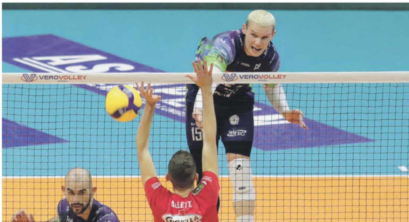
UN ATTACCO DI DAVYSKIBA DEL MONZA CONTRO IL MURO DI ALLETTI DELLA PRISMA TARANTO