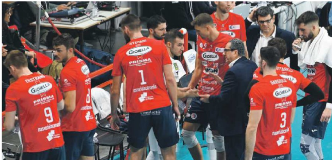
I giocatori della Prisma Gioiella dopo il ko contro Monza

Note: durata set: 33', 31', 39', 44'; tot: 147'.