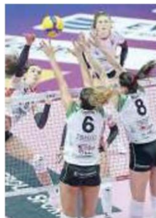
Il muro della Megabox