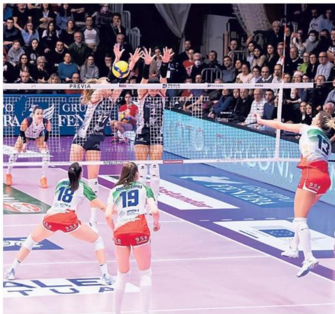
Il Pinerolo avrà il sostegno del pubblico oggi nella sfida a Milano

Un percorso che riparte proprio dalla sfida contro Milano che chiude (assieme a Cuneo-Vallefoglia) la tre giorni di incontri aperta all'Epifania con il successo di un'altra torinese, la Reale Mutua Fenera Chieri contro Casalmaggiore: «Sappiamo bene quali sono le nostre partite da vincere – ma sappiamo anche che ogni match serve per affinare il nostro gioco e per completare il salto di qualità necessario per competere a questo livello». —