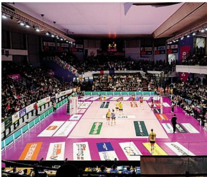
Pubblico delle grandi occasioni ieri sera sulle tribune del Pala Intre