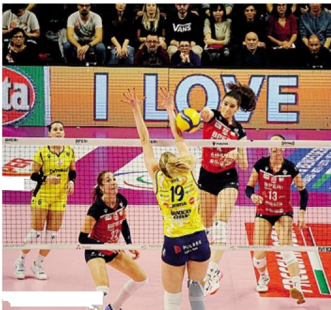
Bozana Butigan alla schiacciata