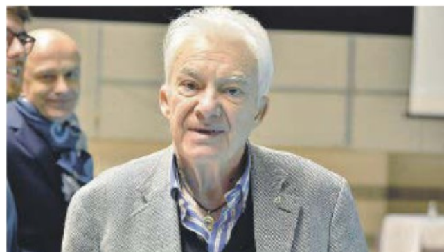
IL PRESIDENTE DELLA PRISMA BONGIOVANNI

ARTICOLO NON CEDIBILE AD ALTRI AD USO ESCLUSIVO DEL CLIENTE CHE LO RICEVE - 4