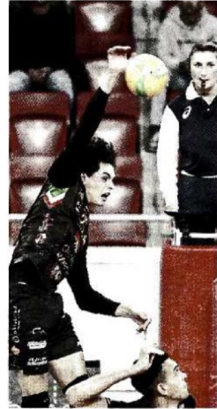
La Lube in Champions