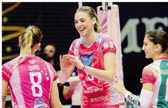
Due immagini delle ragazze di Gaspari durante il match contro Busto Arsizio