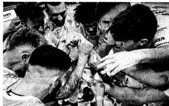
GRUPPO L'esultanza della Top Volley dopo un punto conquistato una scena che quest'anno si è vista tante volte