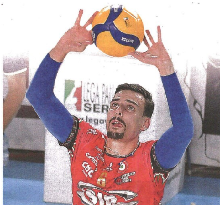
Oro Iridato Simone Giannelli, 26 anni, ha vinto con l'Italia l'oro Mondiale quest'anno

ARTICOLO NON CEDIBILE AD ALTRI AD USO ESCLUSIVO DEL CLIENTE CHE LO RICEVE - 4 - L.1633 - T.1633