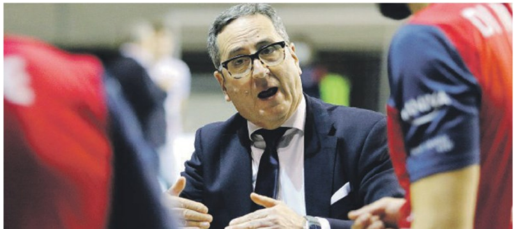
AMAREZZA Prisma sconfitta dopo essere stata in vantaggio 2-0. Il coach Di Pinto e un muro iconico

CLASSIFICA -Tonno Callipo Calabria Vibo Valentia 32 punti; BCC Castellana Grotte 27; Agnelli Tipiesse Bergamo 26; Kemas Lamipel Santa Croce 24; Delta Group Porto Viro, Pool Libertas Cantù 23; Videx Yuasa Grottazzolina 22; BAM Acqua S.Bernardo Cuneo, Conad Reggio Emilia, Consoli McDonald's Brescia 20; Tinet Prata di Pordenone 19; Consar RCM Ravenna 18; Cave del Sole Lagonegro 15; HRK Motta di Livenza 5.