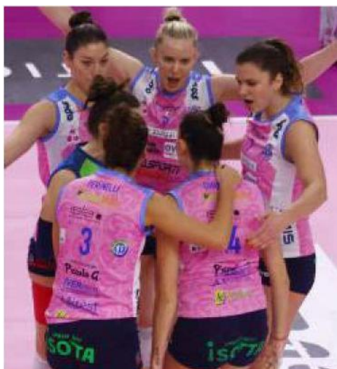
L'esultanza delle rosa dopo un punto