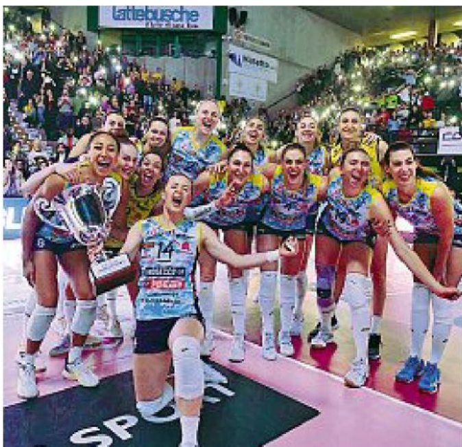
Con i tifosi Conegliano fa festa con la coppa del Mondiale in casa