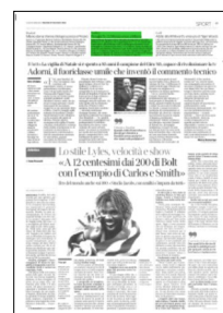
Superficie 3 %

ARTICOLO NON CEDIBILE AD ALTRI AD USO ESCLUSIVO DEL CLIENTE CHE LO RICEVE - 4 - L.1979 - T.1615