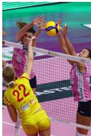
Muro a due di Casalmaggiore