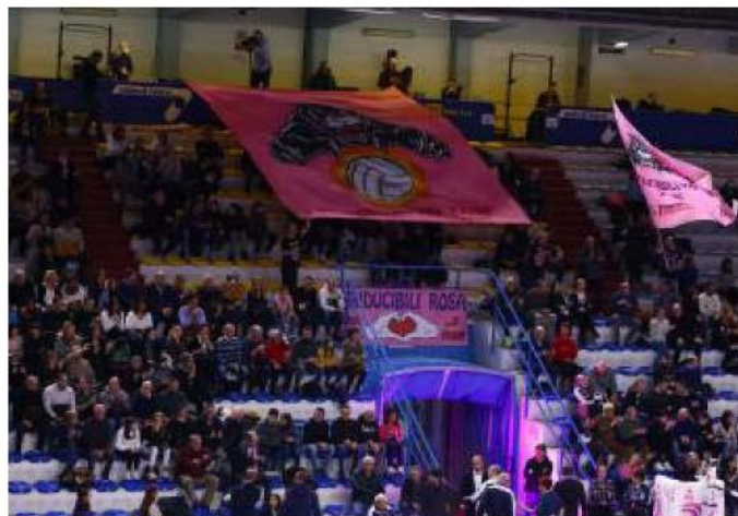
Tanti spettatori al PalaRadi per la sfida di Santo Stefano