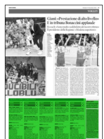
Superficie 31 %