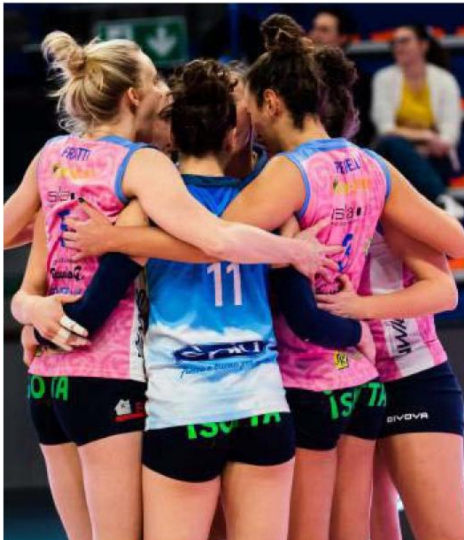
Le ragazze della Vbc unite in un abbraccio prima di un match

Ritaglio Stampa ad uso esclusivo del destinatario. Non riproducibile