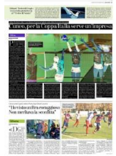
Cuneo, per la Coppa Italia serve un'impresa