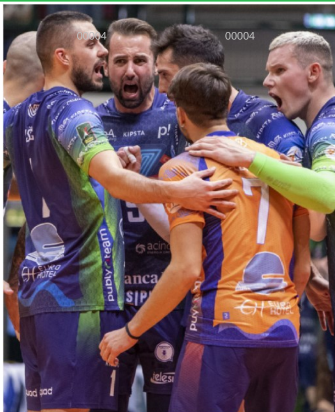
I giocatori del Vero Volley esultano dopo un punto conquistato