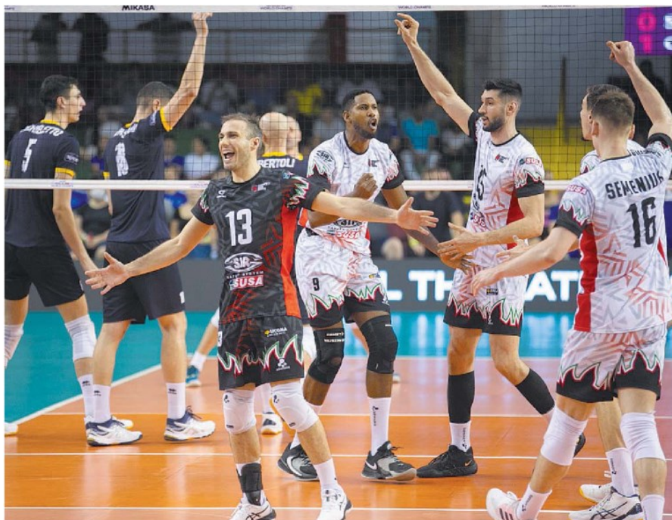
Da Belo Horizonte Trionfo di Perugia nella finalissima con Trento disputata in Brasile → alle pagine 24 e 25

Vinte da Leon e company prima di ieri contro Renata Sada Cruzeiro e Itambè