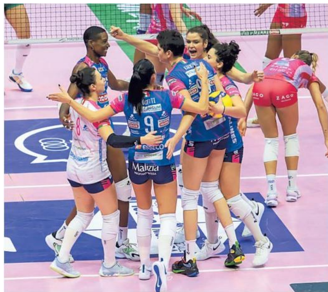
La Igor è andata a espugnare il palasport di Monza al tie break

Ritaglio Stampa ad uso esclusivo del destinatario. Non riproducibile