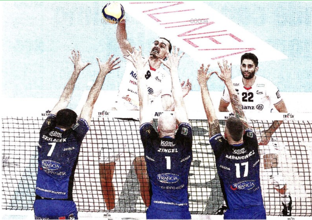
Campione olimpico Jean Patry, 25 anni, opposto francese di Milano: con 167 punti è il top scorer della squadra

ARTICOLO NON CEDIBILE AD ALTRI AD USO ESCLUSIVO DEL CLIENTE CHE LO RICEVE - 4 - L.1737 - T.1737