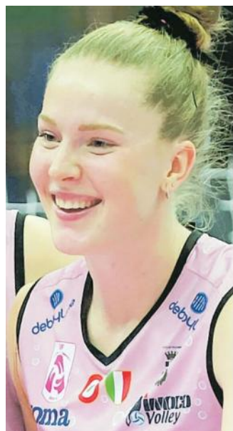
Isabelle Haak, stella dell'Imoco

«Se dovesse succedere, spero che sia nella finale per l'oro. Siamo entrambe squadre forti e sarebbe bello affrontarsi nell'ultima gara del Mondiale». —