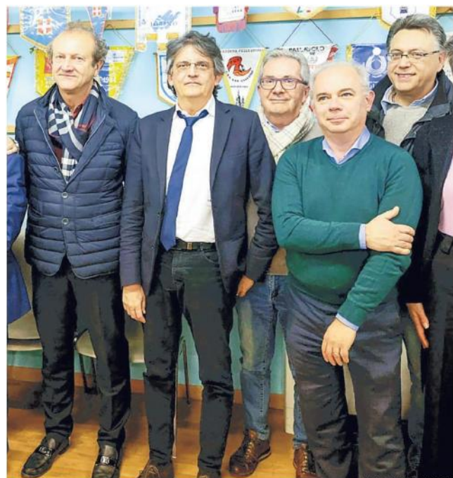
I cinque esponenti delle società di volley che aderiscono al consorzio

Ritaglio Stampa ad uso esclusivo del destinatario. Non riproducibile