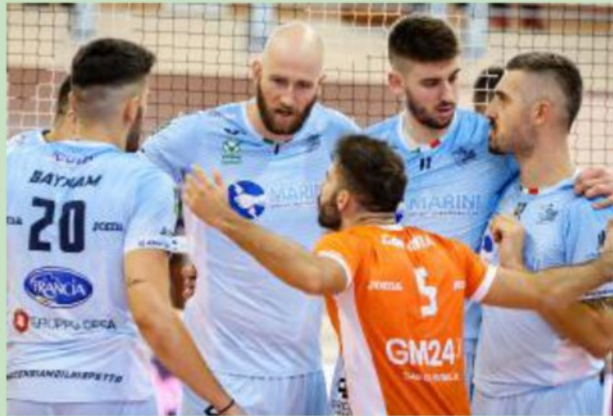
Pronta alla battaglia la Top Volley Cisterna festeggia un punto

La Top Volley Cisterna è stata la squadra rivelazione di questo avvio di stagione. Riaffidata al tecnico Fabio Soli, ha incamerato 9 punti nelle prime tre giornate contro Milano, Taranto e Padova. Poi, però, è incappata in sei sconfitte, la più grave quella interna contro Siena ultima della classe.