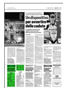
Superficie 5 %

ARTICOLO NON CEDIBILE AD ALTRI AD USO ESCLUSIVO DEL CLIENTE CHE LO RICEVE - 4 - L.1976 - T.1615