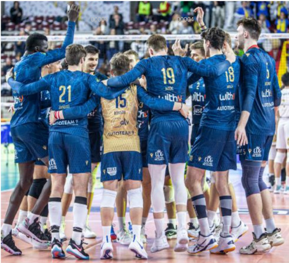
WithU Verona celebra il successo su Siena FOTOEXPRESSZATTARIN

ARTICOLO NON CEDIBILE AD ALTRI AD USO ESCLUSIVO DEL CLIENTE CHE LO RICEVE - 4