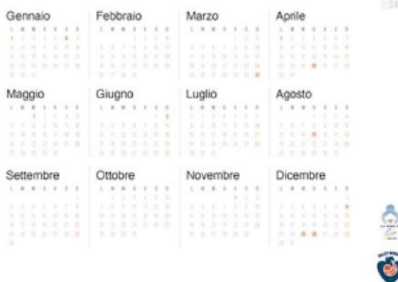
Lo staff del Volley Bergamo 91 nella pagina che riassume tutti i mesi