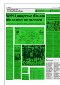
Superficie 71 %

17 Verona è quarta a 17 punti ed è già qualificata per la Coppa Italia. Ma se vince (3-0 o 3-1) è matematicamente seconda