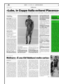
Superficie 7 %

ARTICOLO NON CEDIBILE AD ALTRI AD USO ESCLUSIVO DEL CLIENTE CHE LO RICEVE - 4