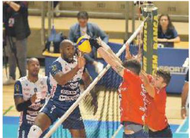
Una fase di gioco della gara di sabato tra Taranto e Piacenza

ARTICOLO NON CEDIBILE AD ALTRI AD USO ESCLUSIVO DEL CLIENTE CHE LO RICEVE - 4