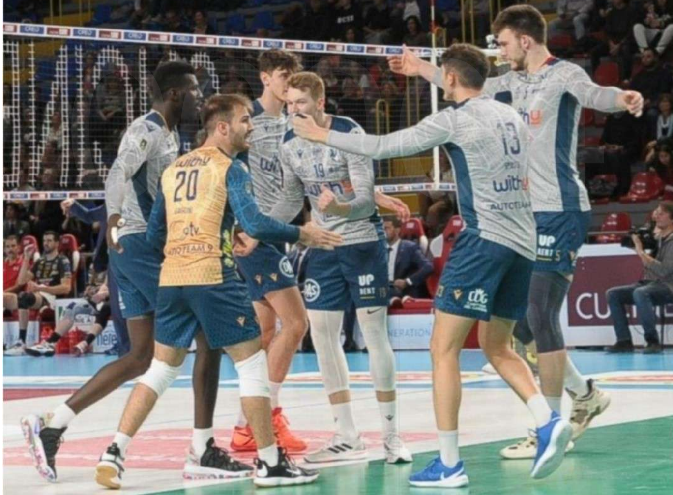
WithU Verona festeggia un punto sul campo dei campioni d'Italia