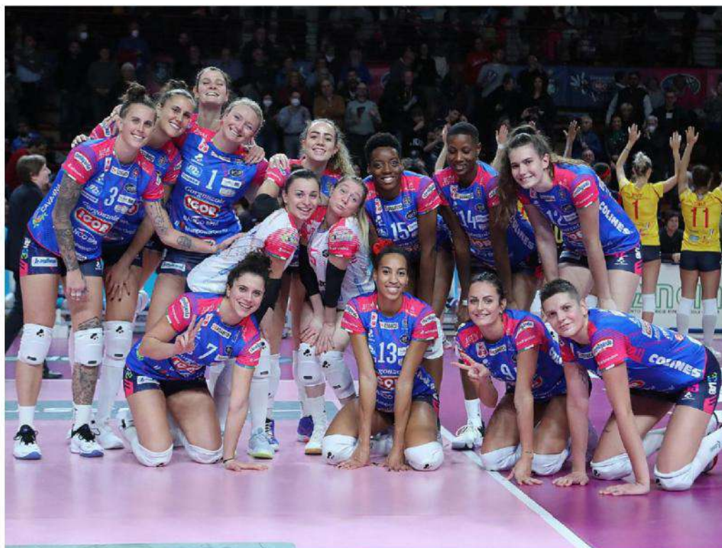
TRE PUNTI NEL CARRIERE Per le ragazze della Igor Volley Novara