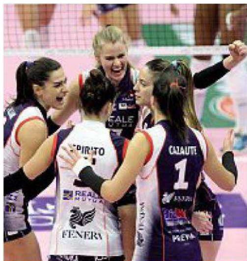
Grande partenza per Chieri, ko solo a Conegliano

Classifica Novara e Conegliano a 14, Milano 13, Scandicci e Chieri 12