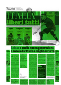
Superficie 83 %

Ex attaccanti Molti di questi ragazzi hanno iniziato come schiacciatori o come palleggiatori e secondo Lorenzetti potrebbe essere un'arma in più. «Un passato da attaccante ti agevola nella lettura del colpo avversario». Oggi i liberi non sono più i «piccoli» da mettere in seconda linea solamente perché a rete farebbero fatica, ma giocatori in grado di incidere in maniera pesante sull'esito di una gara. «L'altezza media si è alzata anche per noi - prosegue Balaso - e più sei alto più riesci a coprire una maggiore porzione di campo». Ma ovviamente l'aspetto principale resta la tecnica. «Ai ragazzi che si avvicinano al nostro ruolo - suggerisce il campione iridato - direi di concentrarsi sulle basi, iniziando dalla sensibilità del bagher, poi lavorare sulla rapidità dei piedi». E probabilmente qualcuno in giro per il mondo inizierà a citare i liberi italiani come l'esempio da