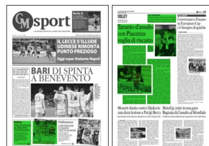
Superficie 42 %