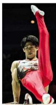
Iridato Daiki Hashimoto, 21 anni, campione mondiale all-around

La doppietta Dopo il titolo olimpico, quello iridato: il giapponese Daiki Hashimoto, nel concorso generale dei Mondiali di artistica di Liverpool, firma una splendida doppietta. Diventando, a 21 anni, il più giovane di sempre a mettere a segno il più prestigiosissimo uno-due. Il nipponico, campione a cinque cerchi anche alla sbarra ed erede sempre più designato del leggendario Kohei Uchimura (sei volte iridato), nonostante problemi a un polso, con un totale di 87,198 punti regala il campione uscente, il cinese Zhang Boheng