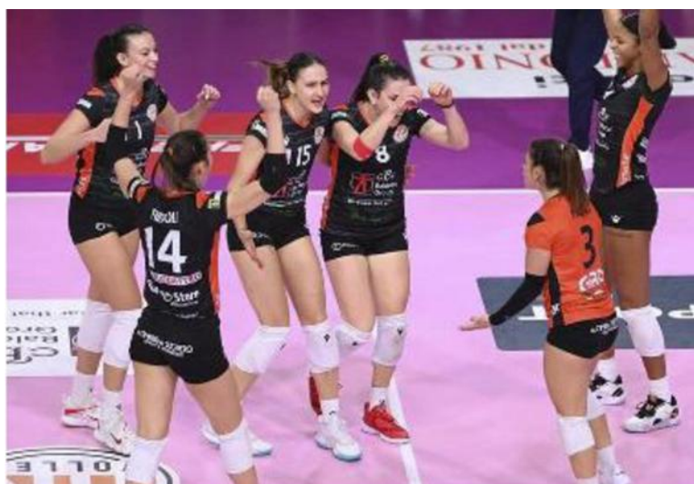
Le giocatrici della Cbf Balducci esultano dopo un punto

Ritaglio Stampa ad uso esclusivo del destinatario. Non riproducibile