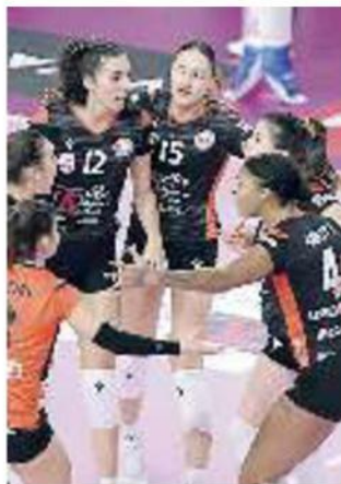
La grinta della Balducci