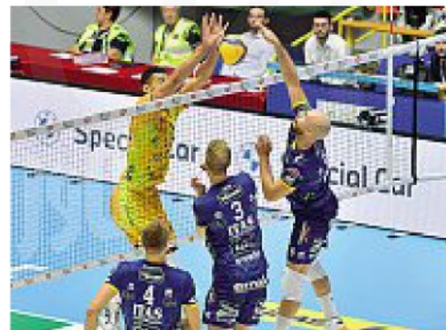
Ciclo duro Per Trento 7 gare molto difficili