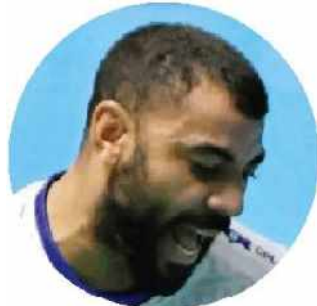
Earving Ngapeth, 31 anni, asso che delude a Modena