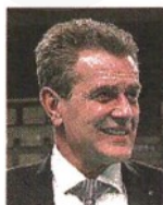
Lorenzetti coach Trento

“ Uniti e sordi alle critiche: è quello che dobbiamo fare. E poi dobbiamo ridurre la durata degli allenamenti