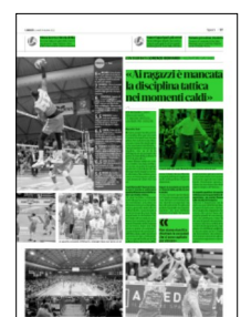
Superficie 24 %

«Questo è importante ma in ogni caso pure gli infortuni fanno parte del percorso e del nostro campionato. Sappiamo che ci sono alti e anche bassi, ed è proprio quando le cose non girano che dobbiamo evitare di toccare dei punti estremamente down. Questa sconfitta deve servirci da insegnamento, sappiamo che dobbiamo migliorare ancora tanto però è chiaro che determinate circostanze e determinate situazioni agli avversari non si possono certo regalare».