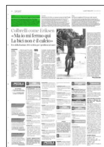
Superficie 3 %

ARTICOLO NON CEDIBILE AD ALTRI AD USO ESCLUSIVO DEL CLIENTE CHE LO RICEVE - 4 - L.1979 - T.1979