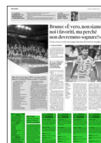
Superficie 19 %