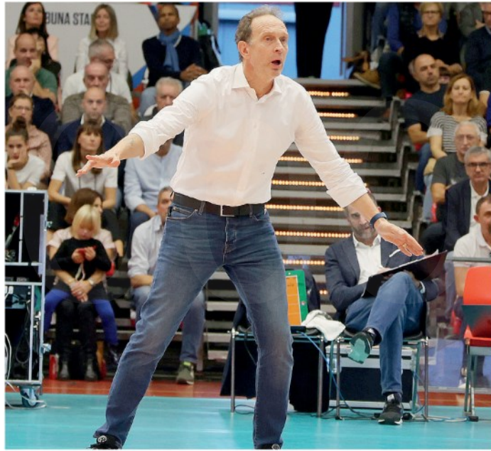
Il coach della Gas Sales Bernardi cerca di dare la carica ai suoi

ARTICOLO NON CEDIBILE AD ALTRI AD USO ESCLUSIVO DEL CLIENTE CHE LO RICEVE - 4