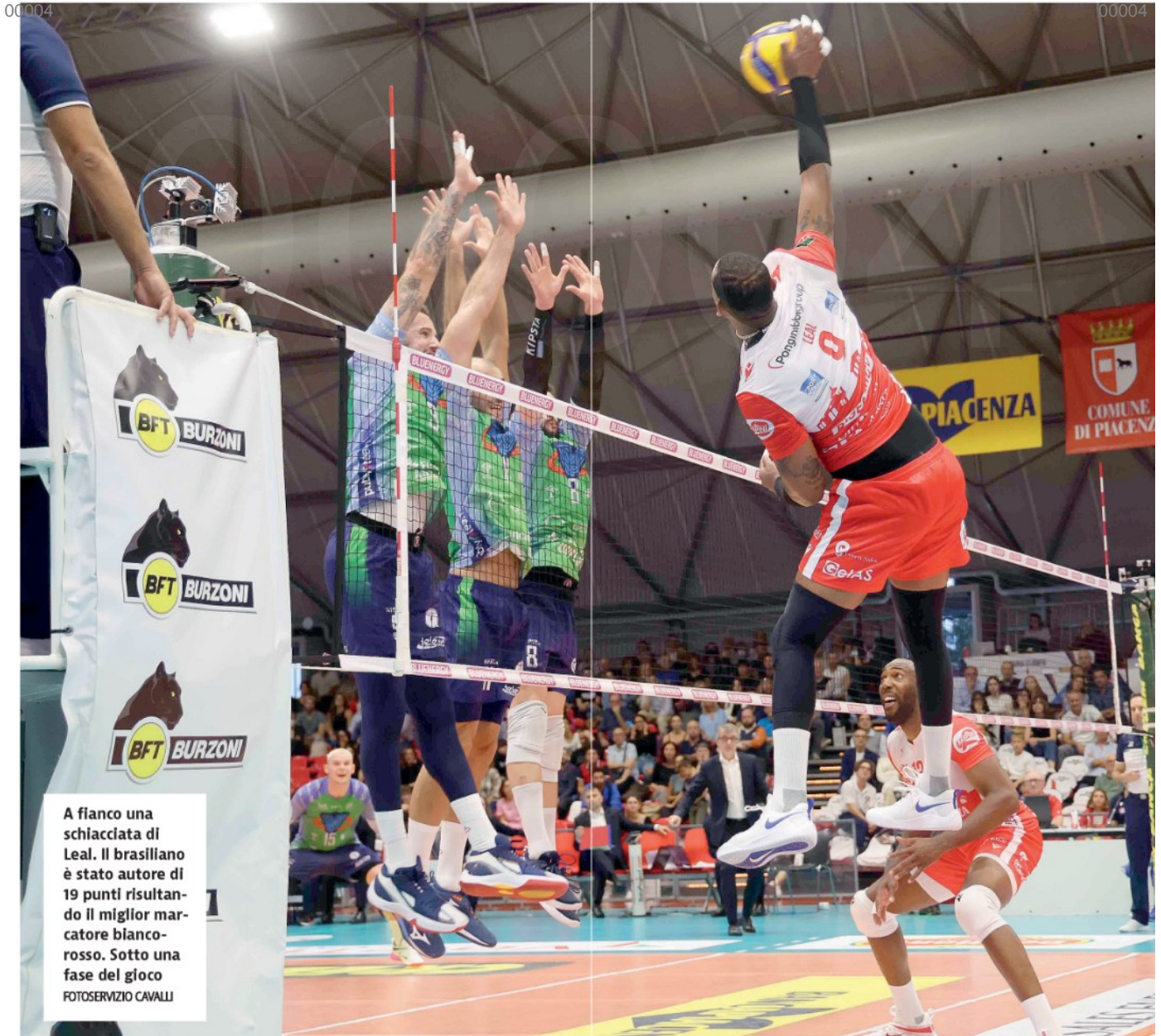
A fianco una schiacciata di Leal. Il brasiliano è stato autore di 19 punti risultando il miglior marcatore bianco-rosso. Sotto una fase del gioco