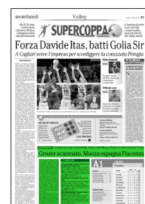
Superficie 12 %

ARTICOLO NON CEDIBILE AD ALTRI AD USO ESCLUSIVO DEL CLIENTE CHE LO RICEVE - 4