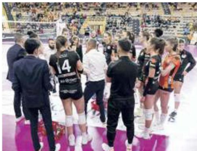
Un'altra partita in casa stasera per la Balducci Macerata