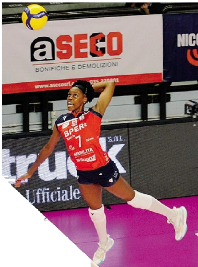
L'elevazione di Lorryna Marys Da Silva in attacco