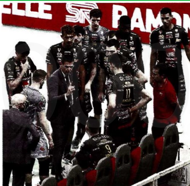
Un timeout della Lube Civitanova durante la partita a Monza

ARTICOLO NON CEDIBILE AD ALTRI AD USO ESCLUSIVO DEL CLIENTE CHE LO RICEVE - 4