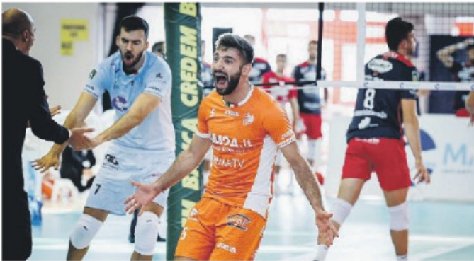
L'esultanza del libero Catania dopo la conquista di un punto