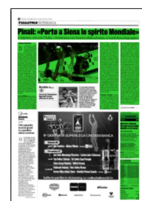
Superficie 41 %