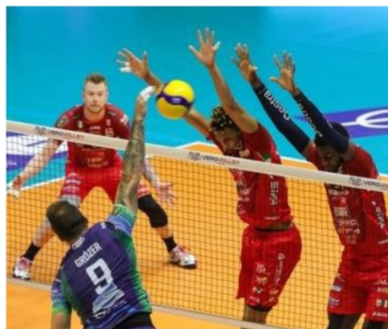
Lube a muro durante il match giocato contro Milano