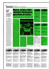
Superficie 44 %

NOTE Spett 3100. Modena: bs 29, v 9, m 8, e 41; Milano: bs 23, v 7, m 4, e 39. T. Gazzetta 6 Patry, 5 Lagumdzija, 4 Melgarejo, 3 Ebadipour, 2 Porro, 1 Rinaldi (p.r.)