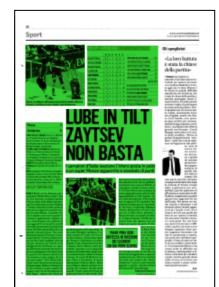
Superficie 47 %